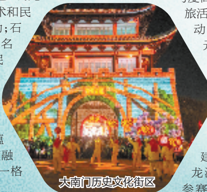
大南门历史文化街区

近年来,龙游县在景区、街区和文旅业态打造和文旅活动策划中,时刻以市场为导向,以创新内容为主题,开展了文博城市创建、文艺赋能工程、凤翔洲龙游马拉松、龙舟队赴国外参赛、国际级舞蹈公开赛、凤