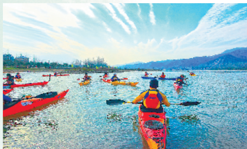
桐庐岛皮划艇体验项目

拼项目,扩投资,富阳将文旅融合工程列入全区“拼经济、拼发展”行动,建立文旅项目库83个,推进览秀城、西岩温泉等24个重大文旅项目建设,完成投资13亿元;黄公望二期文创园、常安虹比庄园提前对外营业,泗洲中国造纸博物馆、西岩温泉项目开工建设;打造“三江两岸”黄金游线辨识度项目,谋划以船秀演艺、游艇项目等发展码头文旅经济;成