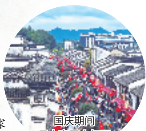
国庆期间吴山商圈人气旺

坚持体育赛事赋能 打响首批省级赛事集聚区品牌 持续提升“一园五中心”服务水平 做优做实场馆惠民开放,组织场馆体验活动 组织群众广泛参与的“弄潮”赛事100场