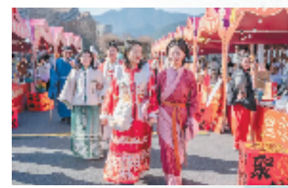
宋福杭州年在富春山居启动

办首届国际皮划艇超级杯、百村篮球赛等赛事活动。让富春山居文化故事声高传远,围绕“家在富春江上”文化品牌,让更多城市资源转化为文旅资源,以高质量公共服务供给让群众近享诗意生活。