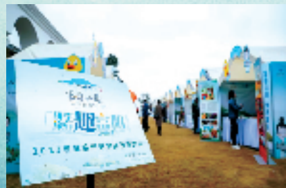
首届杭州研学旅行展交会