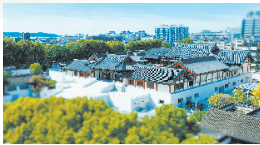
深挖宋风底蕴,打造南宋德寿宫遗址博物馆传世工程。

为吸引广大市民和游客体验上城多元文博资源,去年,上城文旅整合资源构建“1211”博物馆群落建设新模式,全域打造“没有围墙的博物馆”。