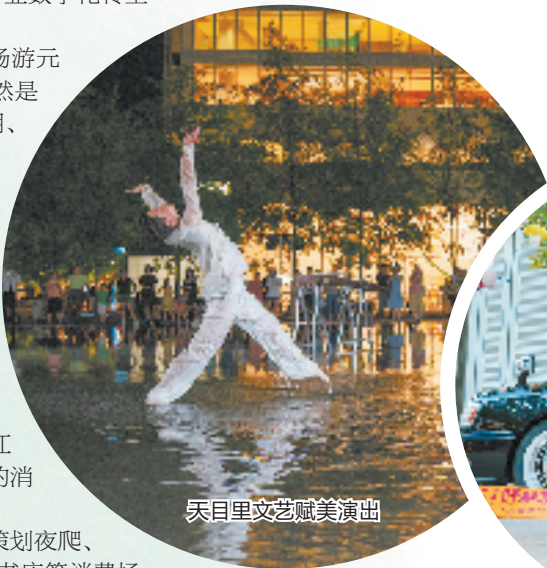
天目里文艺赋能美演出

眼下，西湖区正以高姿态推进人文经济繁荣发展，高站位总结文创领域中可感、可看、可用的“西湖经验”，让想法落地，用创意吸睛，奋力向有特色、有底蕴、有灵气的文化创意之区迈进。