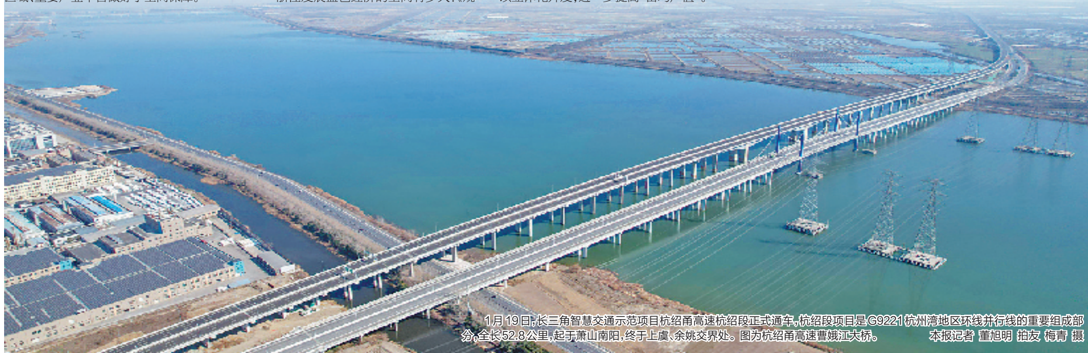
1月19日,长三角智慧交通示范项目杭绍甬高速杭绍段正式通车,杭绍段项目是G9221杭州湾地区环线并线的重要组成部分,全长52.8公里,起于萧山南阳,终于上虞、余姚交界处。图为杭绍甬高速曹娥江大桥。