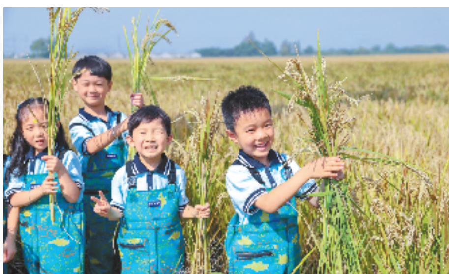
2023年10月19日,湖州市吴兴区东林镇中心小学的孩子们在老师的带领下来到东林镇庵和田连片整治后的高标准农田上户外实践课。(资料照片)

与浙江省国民经济和社会发展第十四个五年规划和2035年远景目标纲要实现有机衔接,《规划》为长三角一体化示范区、浙江舟山群岛新区等国家级新区平台,“万亩千亿”新产业平台,杭州城西科创大走廊、甬江科创大走廊、G60科创走廊等重点区域、重要产业平台做好了空间保障。