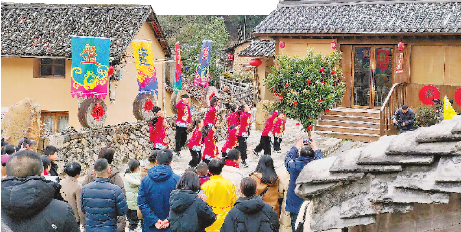
1月27日,“年味香乡幸福畲寨”2024年百村闹春·岗石“村晚”在景宁红星街道岗石村举行。