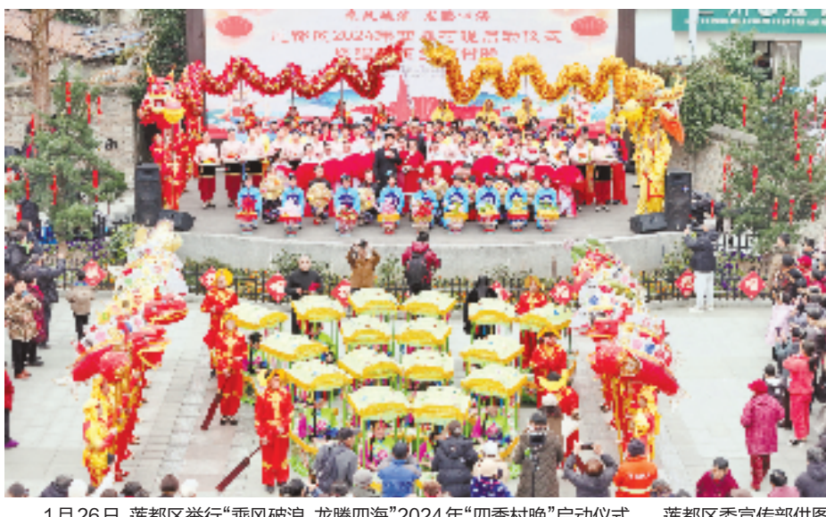
1月26日,莲都区举行“乘风破浪 龙腾四海”2024年“四季村晚”启动仪式。