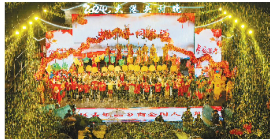
2月3日,“共村晚·同富裕”2024大港头特色“村晚”在古堰画乡举办,观众在雨中撑着伞驻足观看。

丽水市文化和广电旅游体育局党组书记、局长吴飞介绍,“丽水的‘村晚’产业化之路刚刚起步,丽水将持续加大乡村旅游产品有效供给,植入夜娱、夜购、夜游等多种业态,打造更多新场景,让‘村晚’成为一个能留住更多游客的舞台。”