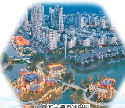
官河古道婺州树屋

同时，黄岩深化强村富民集成改革，迭代升级党建引领共富工坊、飞地抱团、强村公司等发展路径，持续壮大农村集体经济。大力培育柑橘、杨梅、茭白、西瓜等特色产业集群，持续推进美丽乡村“片区组团”发展模式，因地制宜发展乡村旅游、民宿经济、康养休闲等新业态，推动农业“接二连三”，让绿水青山真正变成金山银山。