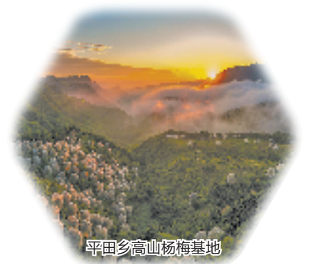
平田乡高山杨梅基地