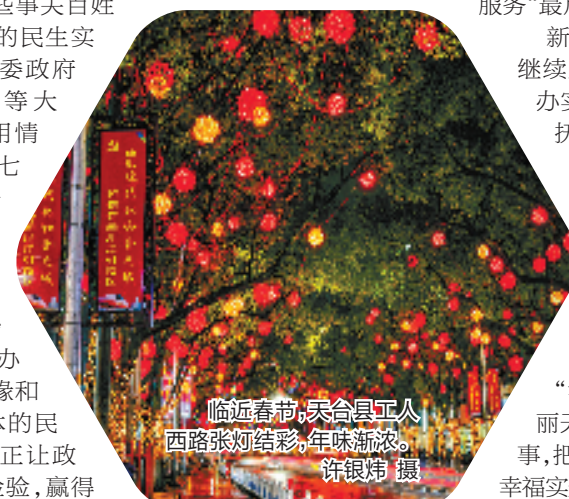
临近春节，天台县工人西路张灯结彩，年味渐浓。

新一年，天台将继续坚持为老百姓办实事，让孩子的抚养教育、青年的就业成才、老人的就医养老等一系列家事，成为打造“学在天台”“健康天台”“温暖天台”“美丽天台”的“美丽天台”的大事要事，把民生愿景干成幸福实景。