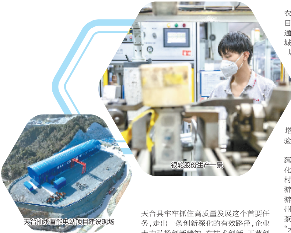
银轮股份生产一景