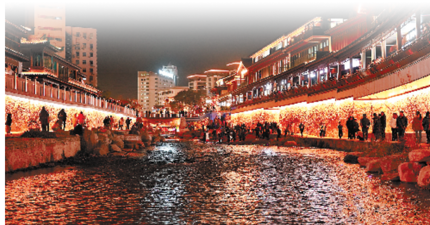
天台县赭溪老街吸引八方来客