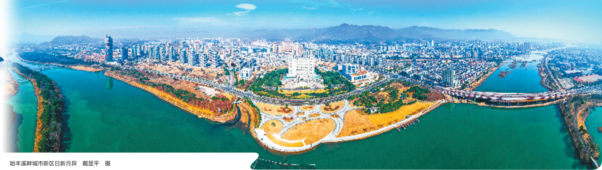
始丰溪畔城市新区日新月异

翻开“2023记事簿”，一览全年大事记，成果丰硕。 台州市天台县深入践行“八八战略”，奋力推进“六大跨越”，经济向好、发展向强、民生向优，入选全国学习运用“千万工程”经验现场推进会考察点、国家共富实践观察地，获得首批“浙江制造天工鼎”、省乡村振兴考核优秀县等31项省级以上荣誉。 岁序更替，华章又新。 刚迈入2024年，天台就展现了一个活力满满、热气腾腾的场景：赭溪老街精彩亮相，元旦期间古城街景吸引游客超40万人次。 新一年，在喜庆祥和的氛围中拉开序幕，全县上下掀起感恩奋进、实干争先热潮，贯通落实省委突破性创新、攻坚性改革、提升性开放三条路径和市委“三高三新”战略部署，大力实施科创赋能、基础设施建设、文旅旅游、和合文化、城乡融合“五大新行动”，高质量建设现代化和合之城。