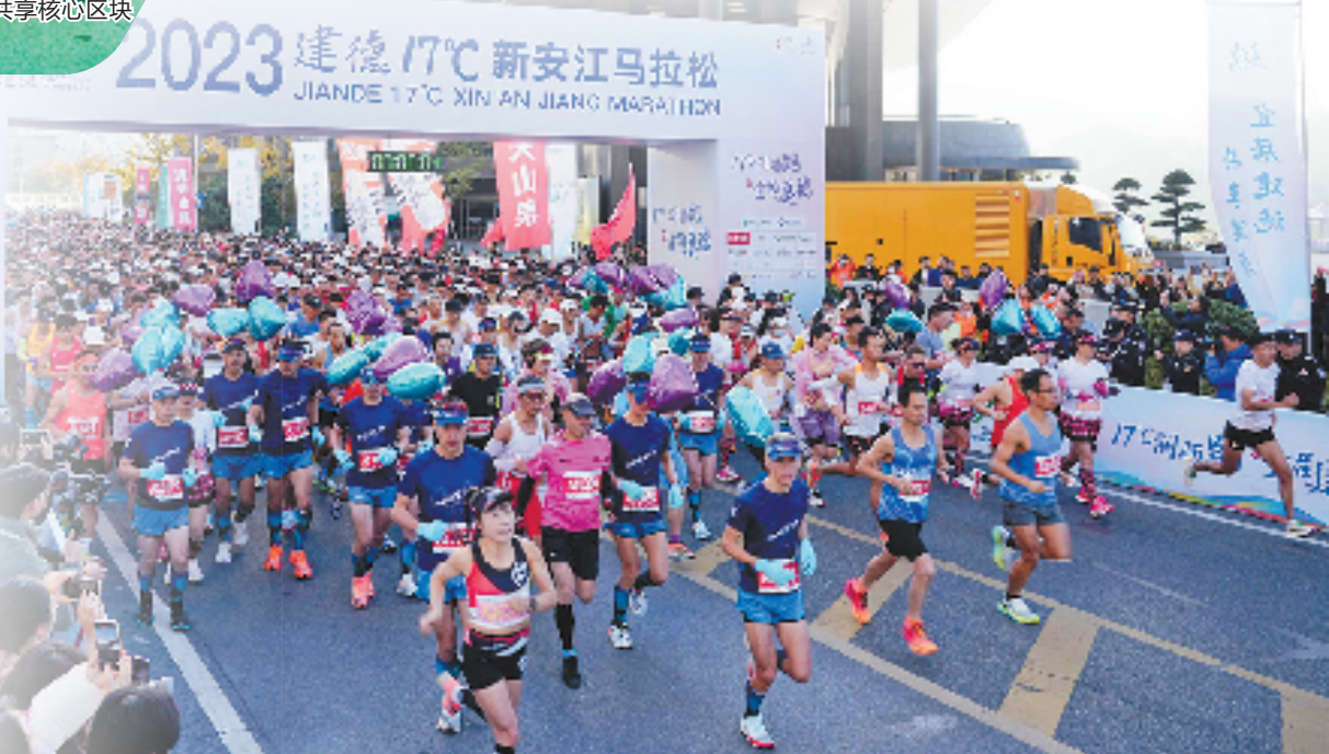
建德举办2023建德17°C新安江马拉松,以体育赛事激活文旅市场。