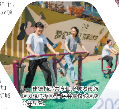
建德打造共享山水城市新城区风貌样板区,市民共享核心区域公共配套。

商贸旅游稳步向好。连续5年入围“全国县域旅游综合实力百强县”,创成省全域旅游示范市,预计全年游客接待量突破760万人次、实现旅游总收入63亿元;成功举办隅田川咖啡音乐节、夏日冬泳、马拉松、航空飞行大会等活动,现场引流超过15万人次;实现社会消费品零售总额136亿元、增长5.4%。