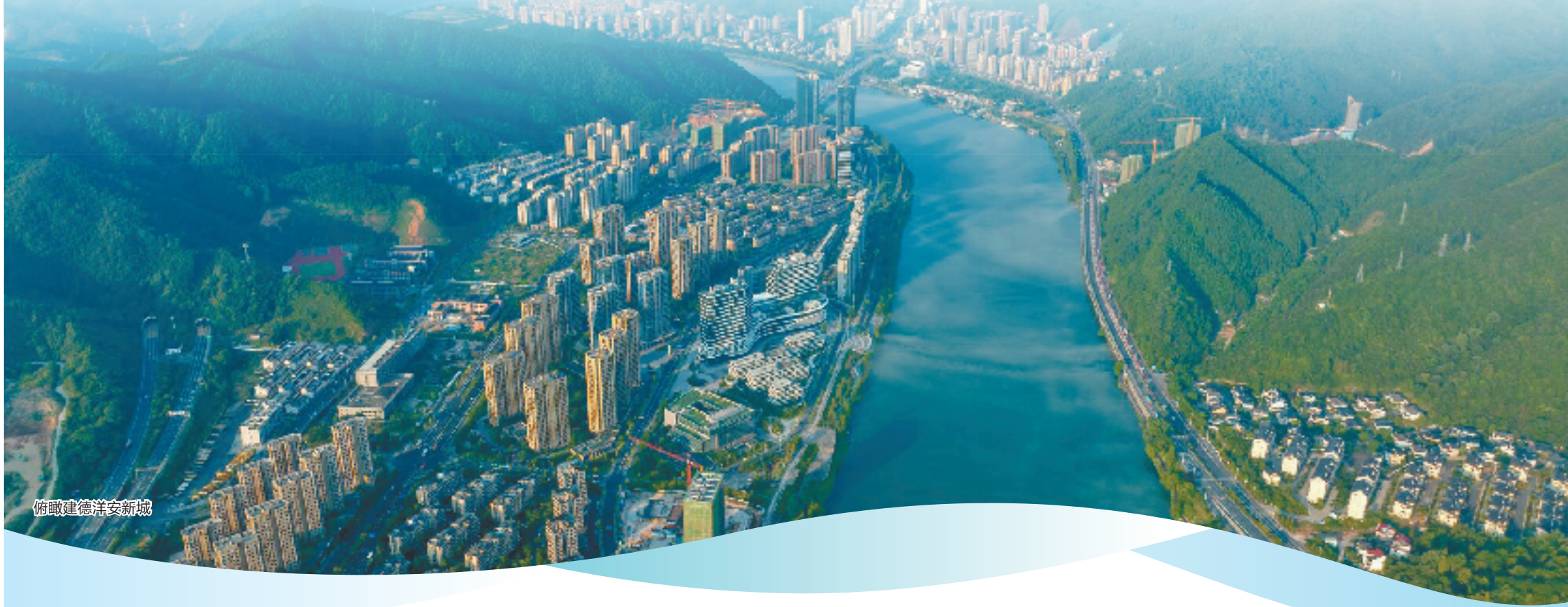
俯瞰建德洋安新城

作为杭州一县,建德如何为杭州“勇攀高峰、勇立潮头”贡献更大的县域力量?三个关键词,提炼建德在难中求进中摸索出的实战经验以及勇攀高峰再出发的目标方向。