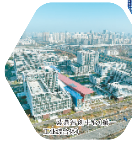
荟鼎智创中心(第一工业综合体)

机制有个显著特点,‘小政府、大服务’。”高新区(滨江)审管办有关负责人列了一组数据,“前不久,我们对整个政务大厅的全年业务量做了梳理,发现线上线下的业务量有200多万件。这么多的业务统筹在同一个政务大厅内进行办理,对于窗口专员来说,业务浓度其实非常饱和。”眼下,高新区(滨江)正在全域打造一