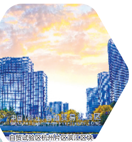
自贸试验区杭州片区滨江区块

不妨以客“流”为切入点,来观察亚运带来的集聚效应——“大小莲花”丝滑转场,演唱会会场连开,不少本地居民、外地