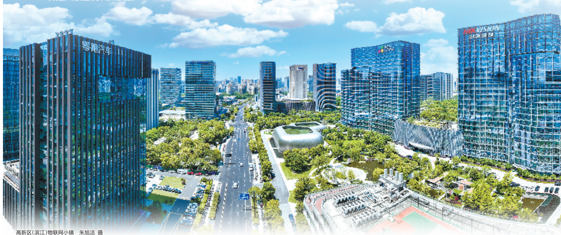
高新区(滨江)物联网小镇

过去一年,虽面临多重压力,高新区(滨江)经济运行却呈现出持续向好的态势,在稳进提质中扛起了创新强区、产业大区的责任担当,用高新区的“稳”与“进”为全市打赢“经济翻身仗”作出贡献。