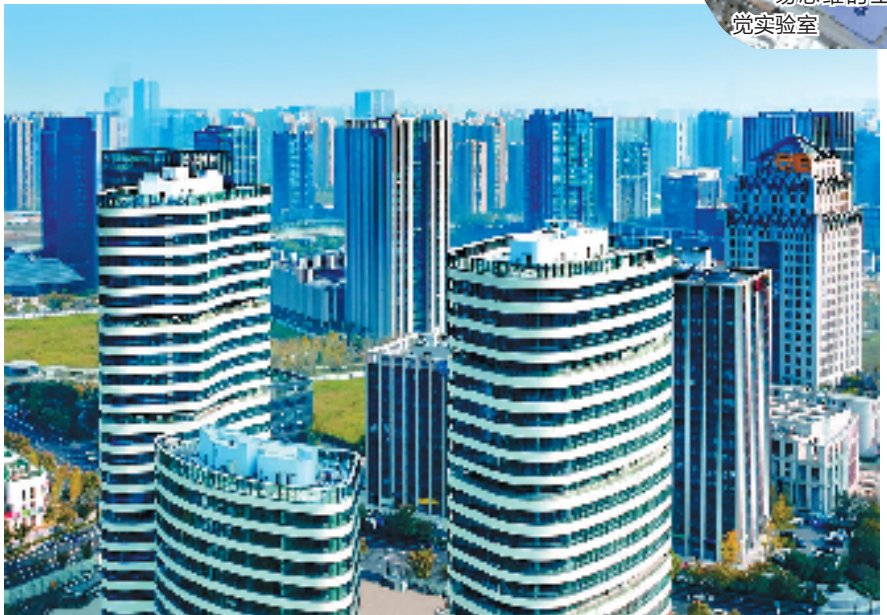
数谷大厦

杭州正在深入推进城西科创大走廊、城东智造大走廊建设,杭州市委、市政府赋予高新区(滨江)“两廊”联动核心节点定位,借“一区多园”模式,高新区(滨江)作为重要的产业策源地,在整个杭州的枢纽地位将再提升。