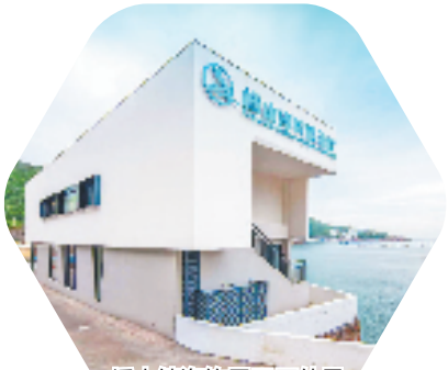
嵊山镇海钓展示厅外景

汛, 小镇忽而变得热闹喧嚣, 风浪小时渔船竞发出海作业, 风浪大时便暂歇战鼓, 渔民上岸, 小岛人山人海。