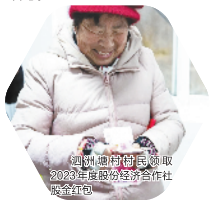
泗洲塘村村民领取2023年度股份经济合作社股金红包

今年, 嵊山将继续在民生服务保障、安全生产管理等方面多管齐下, 通过完善海岛养老服务体系、提升海岛医疗救护能力、抓好重点领域安全生产工作、配合大综合一体化行政执法改革等工作措施, 保障嵊山居民住得舒心、安心、开心。