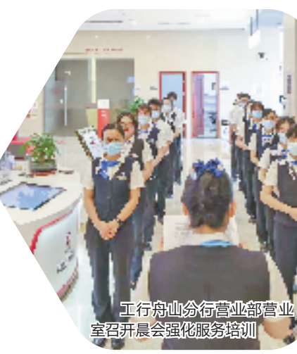
工行舟山分行营业部营业部召开晨会强化服务培训

大。工行舟山普陀支行工作人员了解到该企业有融资需求后, 第一时间与企业取得联系, 并与企业确定以食品加工技术专利权作为贷款的押品。该笔贷款的顺利发放为企业发展提供了有力的金融支撑。