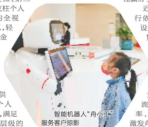
智能机器人“舟小工”服务客户掠影