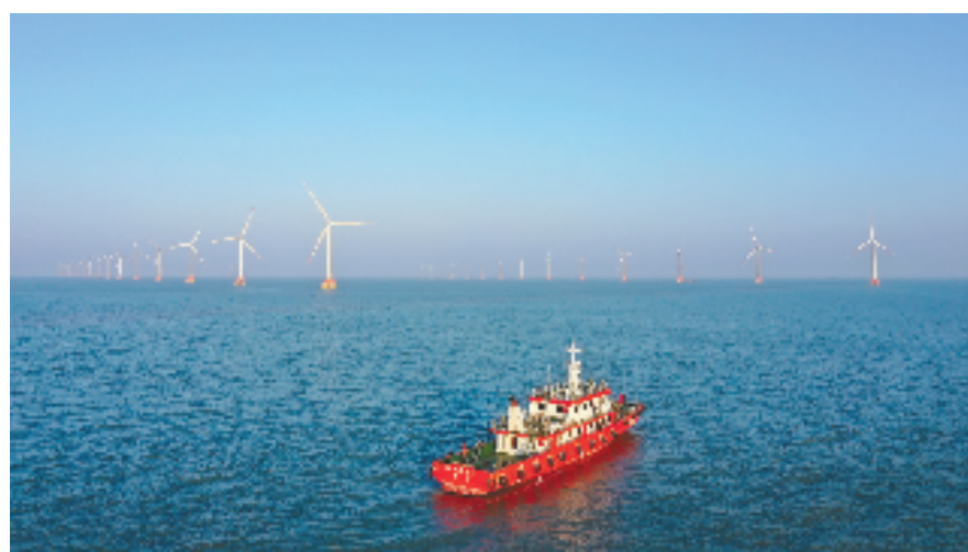
舟山岱山海上风电掠影

聚焦转型, 点燃绿色金融新引擎。该行深入践行“绿水青山就是金山银山”理念, 依托区域资源禀赋, 加大对海上风电、光伏发电、LNG储运等领域的信贷投放力度, 并加大对符合绿色低碳转型要求的能源、工业、建筑、交通、农业和居民生活等重点领域、重点项目的业务拓展, 提升绿色金融综合服务能力。目前已向LNG储运项目提供融资5.3亿元, 向嵊泗、岱山海上风电项目投放贷款6亿元, 先后为嵊泗全域旅游示范岛提升项目、普陀桃花岛景区建设等投放资金5亿元。