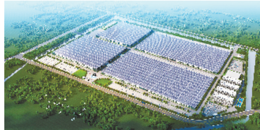
晶科产业园效果图

楚门蒲田村全村1947名村民成为“股东”，参股新建小微企业园；清港众创共富中心让文旦“接二连三”火出圈，“黄金果”真正成为村民的“致富果”；鸡山中鹿岛“一条大黄鱼”游出一片致富渔场；国内首个海捕虾全产业链移动加工中心“浙玉渔加99999”更是带动坎门街道129艘捕虾船平均年增收50余万元……物阜民丰，便是最大的幸福。在玉环，这一切都变得更为真实、可感。