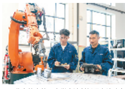
北京航空航天大学宁波创新研究院助力企业攻关技术难题