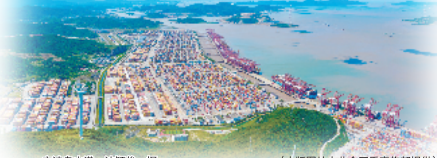
宁波舟山港