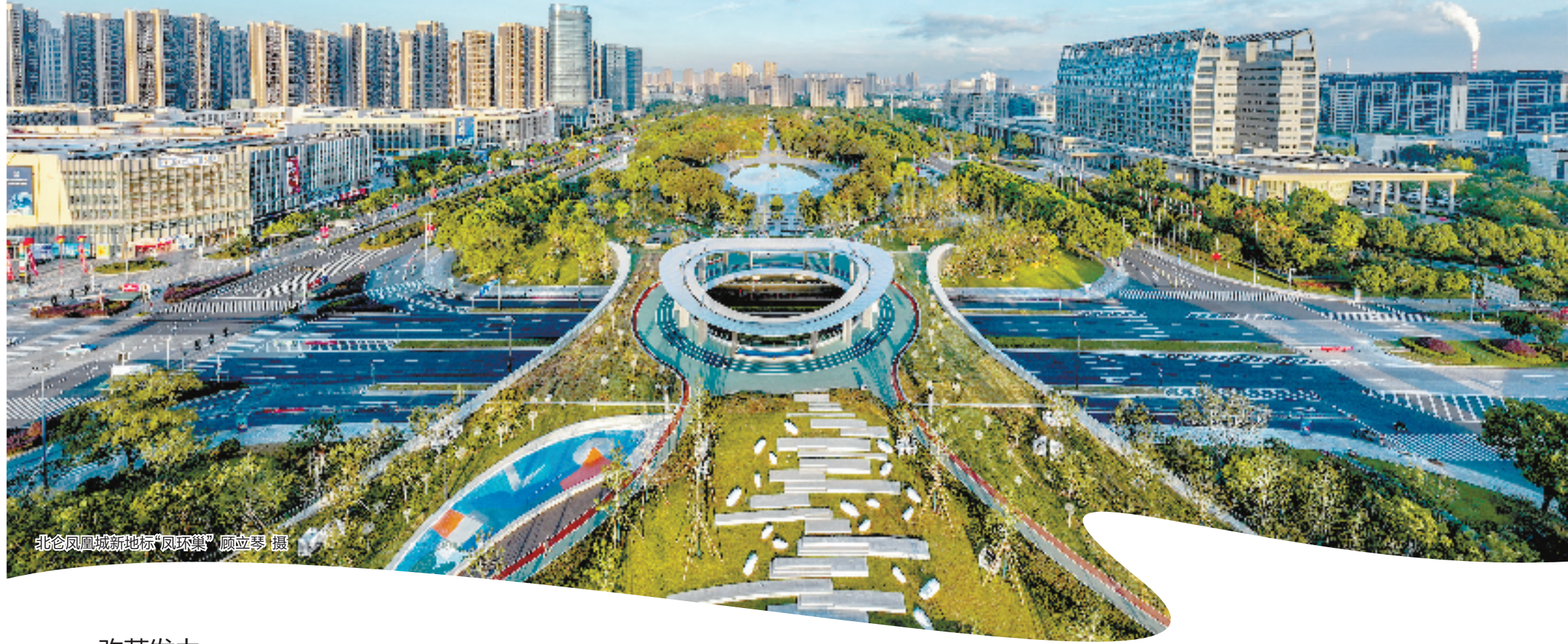
北仑凤凰城新地标“凤环”

沉甸甸的数据，凝结了数不清的艰辛与奋进，更汇聚成风雨兼程的勇毅与笃行。2024年，是北仑开发建设40周年。四十不惑！北仑将坚决扛起“大块头”的使命担当，奋力开创现代化滨海大都市高能门户建设崭新局面，为“谱写中国式现代化浙江新篇章”作出新的更大贡献。