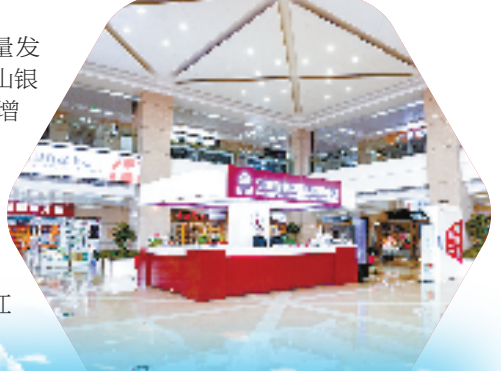
跨境网购自提中心

潮涌东方看北仑！新的一年，北仑将勇担使命、勇挑大梁、踔厉奋发、笃行实干，驶向更加壮阔的航程。