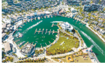
宁波北仑万博鱼度假区