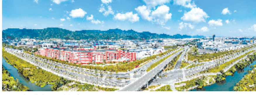
灵峰现代产业园