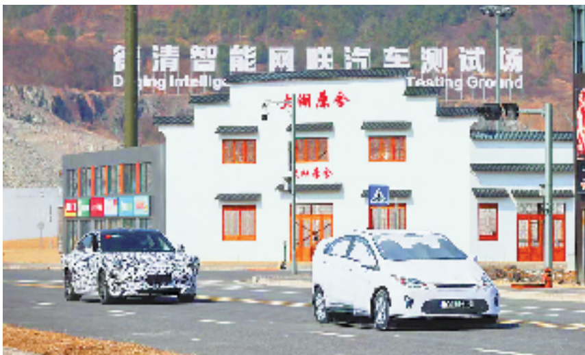
德清智能网联汽车测试场,测试车(左)进行自动紧急刹车(AEB)测试。