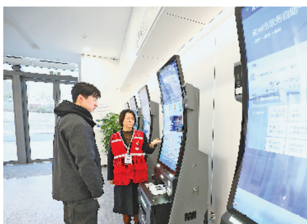
志愿者在衢州企业综合服务中心大厅演示“政企通”操作。