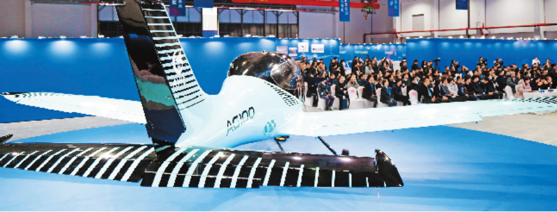
1月19日,新一代初级教练机领雁AG100首批飞机在湖州莫干山高新区临杭产业新区下线交付。AG100是航空工业通飞公司与德清合作、在湖州莫干山高新区落地的首个整机研制项目。

省两会拉开帷幕,记者在现场感受热度最高的一个话题,就是“经济大省勇挑大梁”。 大省和大梁,“大”要有大的责任担当——去年9月,习近平总书记考察浙江,赋予浙江“中国式现代化的先行者”新定位,“奋力谱写中国式现代化浙江新篇章”新使命;去年12月,中央经济工作会议明确要求:经济大省要真正挑起大梁。 代表委员认为,使命重于千钧,要以更高站位、更大格局、更宽视野来谋划工作,以浙江的“稳”“进”“立”为全国大局多作贡献。