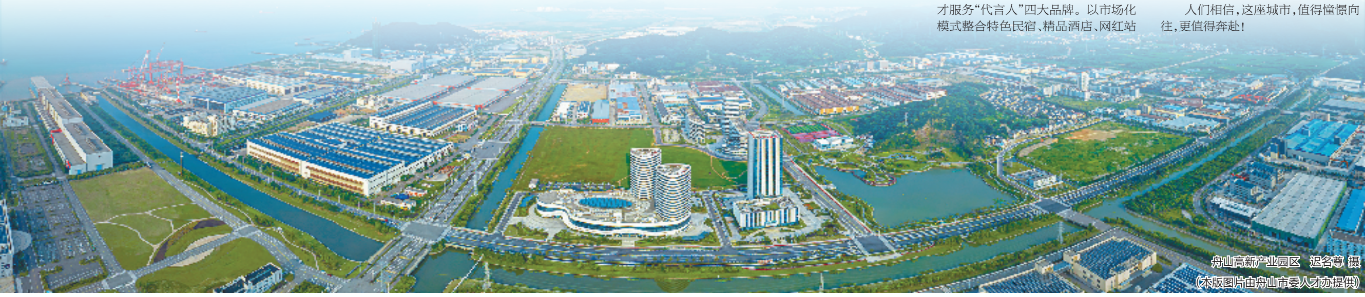
舟山高新产业园区