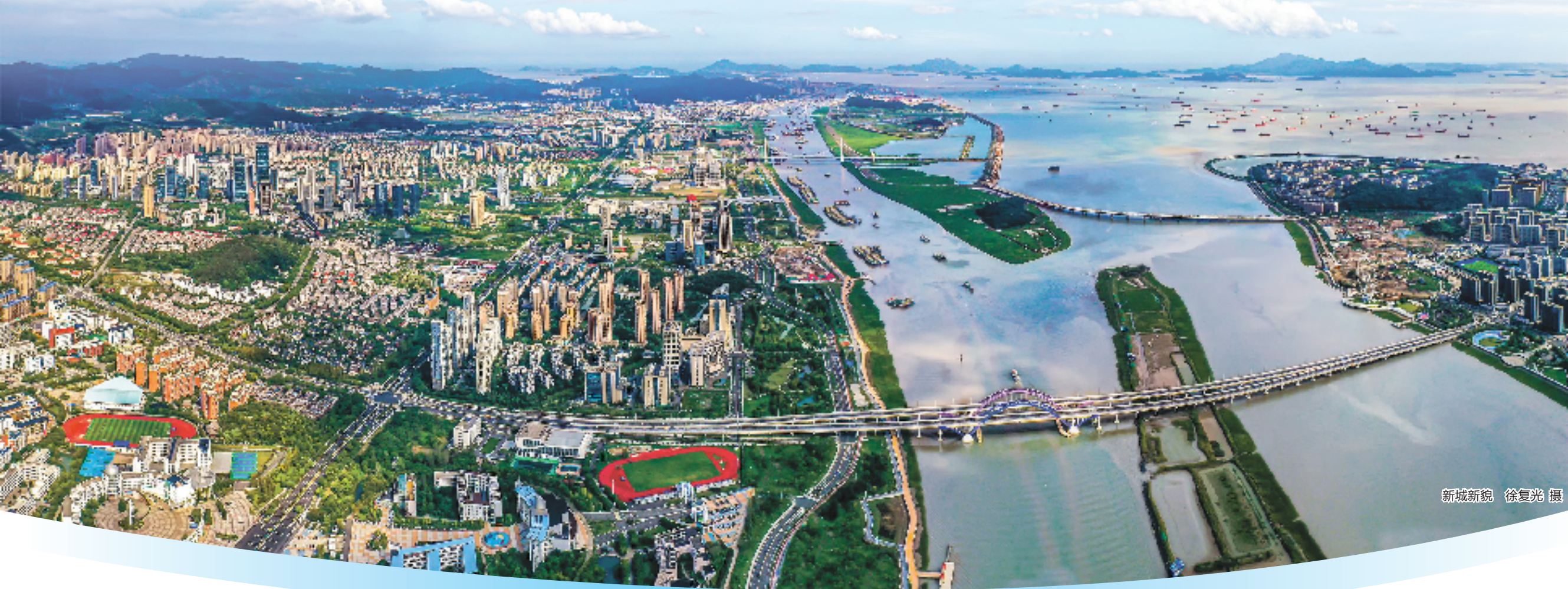
新城新貌

人才是强市之本、创新之源、发展之基。近5年,舟山累计引育高层次海洋创新人才431人,引进高校毕业生7.08万人。2023年中国城市引力榜中,舟山位居第32位,排名较上年提升4位。这些数据的背后,是舟山苦练内功的结果。2023年,舟山紧紧围绕“加快打造新时代海洋特色人才港”目标,在引聚重点人才、布局发展平台、完善优质服务上务实功、出实招、求实效。舟山,这个海岛城市的人才吸引力和凝聚力越来越强,越来越多的人和这个城市实现了“双向奔赴”。