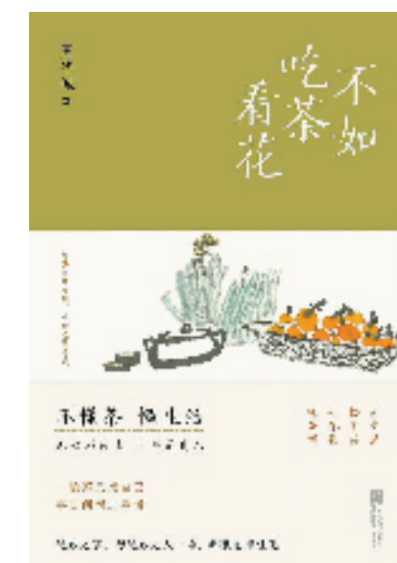
《不如吃茶看花》书封

知道周华诚起于他的“父亲的水稻田”活动。2014年，他发起了“父亲的水稻田”众筹项目，邀请生活在城市的人和他一起，走进老家衢州常山的稻田，感受春秋秋收，记录农耕生活，体验劳动的快乐、做农民的快乐、收获的快乐。尔后，他不但收获了田里的稻谷，更收获心间的文字，把稻米与书一起寄给参与者，如今这一模式在不少地方复