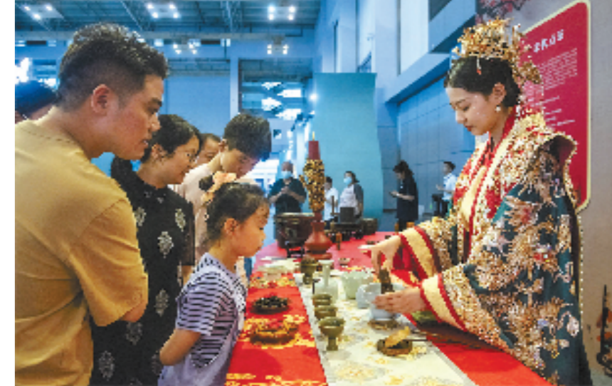
文博会上市民体验宋代点茶 (本版图片由宁波市市委宣传部提供)

8000年海洋文明史、2500年港城建设史、1200年城市发展史,千年文脉悠歌不绝。 当我们从文化历史的坐标系中回首过去,展望未来,不禁心潮澎湃。三江两岸春潮涌动,四明大地生机勃勃,东方港城勇立潮头,宁波在全力打造新时代文化高地的路上踏歌而行。 过去一年,舞剧《东方大港》进京首演,交响套曲《港通天下》、越剧《走马御史》全国巡演……一批宁波原创、宁波制作、宁波出品的大作、大戏、大剧、大片,唱响了“新时代之歌”。 过去一年,“15分钟品质文化圈”、“一人一艺”全民艺术普及工程、“文艺星火赋美”工程……一批文化工程构建起城乡一体的公共文化服务网络,让公共文化服务的“宁波样本”根深叶茂。 宁波人的幸福感在点点滴滴的文化浸润中不断增强。 2023年,宁波第14次上榜“中国最具幸福感城市”,在这之前已经实现全国文明城市“六连冠”。 这背后,是一次次经典时刻、一个个先进典型,宁波不断书写着崇德向善、文明有礼、精神富有的崭新篇章—— 一簇簇火,映照文明。当杭州第19届亚运会开幕式上,宁波奥运冠军汪顺举起宁波企业“方太”智造的火炬,和数字人火炬手一起,点亮了装在宁波“大丰实业”智造的火炬塔里由宁波研发机构自主开发的绿色甲醇燃料,成就了经典的“宁波时刻”。在新时代,“奥运冠军之城”和“制造业单项冠军之城”,以专注和韧劲、硬碰硬与灵气,为这座城市建设现代化滨海大都市,打造中国式现代化城市样板的实践,写下生动注脚。 爱心,是这座城市的起点,也是初心。“顺其自然”连续25年来匿名捐款,累计1577万元;人体器官捐献爱心人士,成功挽救了1000多名器官衰竭患者的生命;“爱心茶亭”“爱心钢琴”等一大批慈善善举遍布城市角落……宁波普通市民身边无数动人的点滴瞬间,让文明宁波的城市名片熠熠生辉。 山与海的澎湃,城与乡的共生。从风貌提升到内在建设,广袤的乡野和蓬勃的城市,正在迎接建筑共同富裕现代化基本单元的全新实践:联动推进未来社区和未来乡村建设,城与乡相向而行。2023年,随着宁波美丽城镇新一轮创建的开启,106个乡镇因地制宜,“各显神通”,以现代化理念推进美丽城镇动能变革,持续擦亮共同富裕的幸福底色。 如今,现代文明犹如一滴淡水,在四明大地上不断流淌,一幅画卷徐徐展开——这是一个更广阔的新时代文化高地,一个更丰富的中华现代文明城市样本。