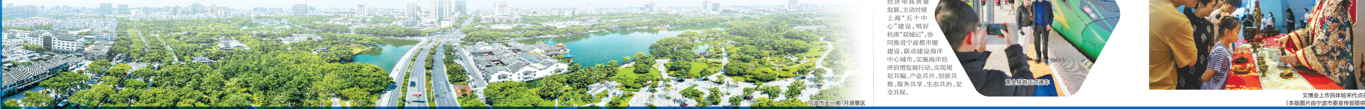
宁波市天一阁·月湖景区