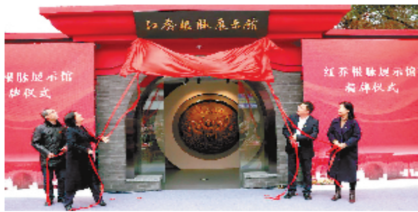
红乔根脉展示馆正式揭牌启用

统产业基地携手，盘活红色资源，让群众以可视可感的方式，追寻红色记忆。 未来，乔司街道还将与浙江大学、浙大城市学院等高校联合推动校地合作，以更高能级实现资源共享、人才共育，推动新时代青少年传承红色基因。