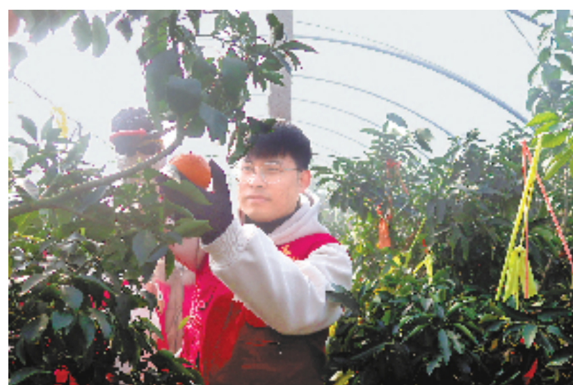
志愿者正在进行红美人采摘

要赶紧卖掉，作为于城镇众多共富工坊中的一份子，我们有直播电商这个优势条件，理应有这个责任来爱心助农。” 去年以来，海盐县胜利农场电商直播“共富工坊”先后通过淘宝、抖音、拼多多等平台，打通了农产品线上销售渠道，为促进群众稳定增收，助力乡村振兴，带动创业致富起到示范作用。联合于城镇各村社区举办直播带货活动5场，销售八字葡萄、何家蜜梨、于城甲鱼等农产品，实现农产品销售额62.8万元，带动各村集体增收50余万元。在2023年成功入选浙江省首批百家电商直播“共富工坊”典型案例。 据了解，从去年12月21日开始，接到果农求助的于城镇政府积极组织20余位党员志愿者开展救助，帮忙找销路，联合本地胜利农场共富工坊开展公益助农直播。党员志愿者们齐心协力，将一颗颗来不及采摘的红美人从枝头摘下、包装、装车。截至目前，4万斤的红美人已全部售出。 “爱心助农 促销增收”系列活动，以“温度”拓展基层治理的“深度”，把多种形式的暖心服务送到居民家门口，为于城镇增添浓浓暖意。