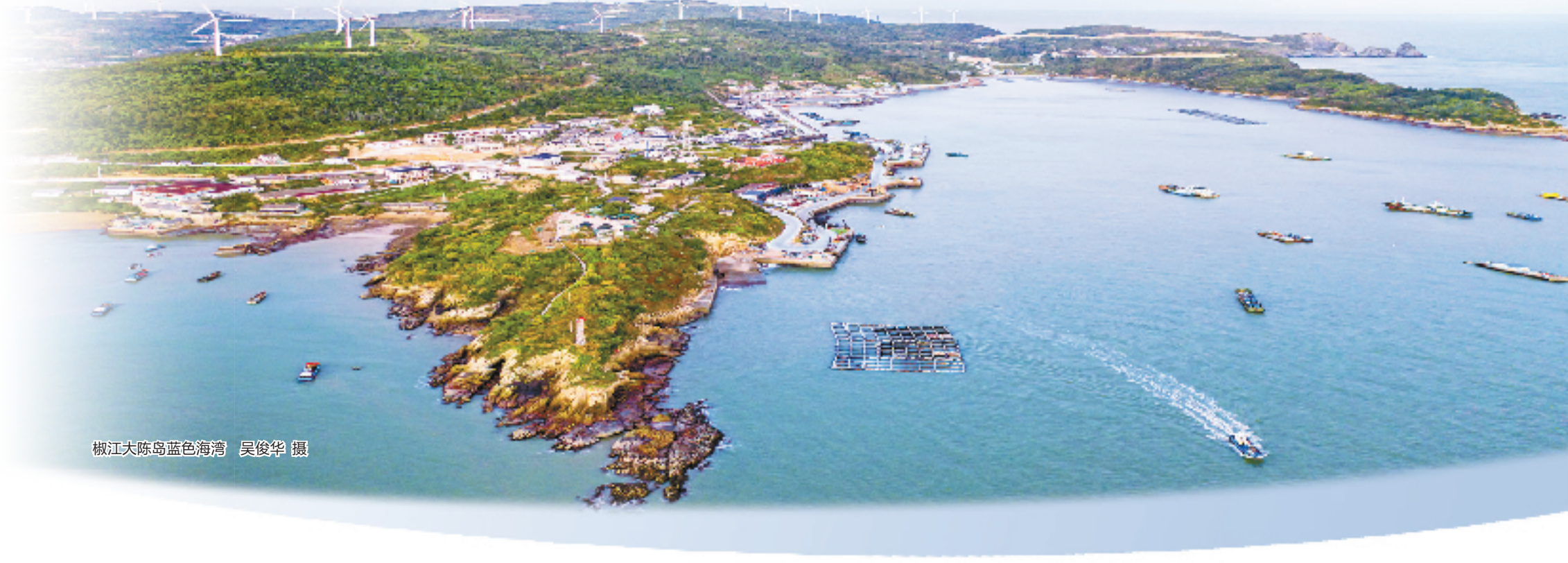
椒江大陈岛蓝色海湾

今年，椒江将以政务服务增值化改革为牵引，全力打造“企业最有感”的营商环境，持续推进营商环境优化提升“一号改革工程”走深走实，推动民营经济高质量发展。