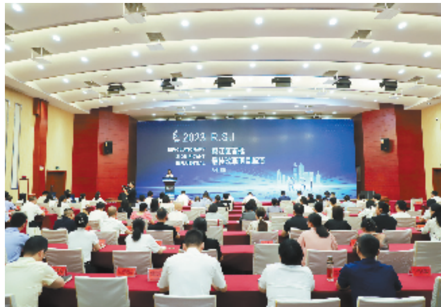
“R.S.I”椒江区最佳改革项目路演

解纷模式、家事化解“一类事”等一批改革攻坚的生动实践，椒江将继续以群众和企业的期盼需求为落脚点，主动探索、奋力攻坚，在更多领域持续创新、勇于变革，推动椒江改革工作实现整体跃升，助力经济社会高质量发展。