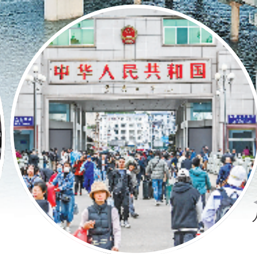
2023年12月20日,广西东兴口岸人员货物通关两旺。