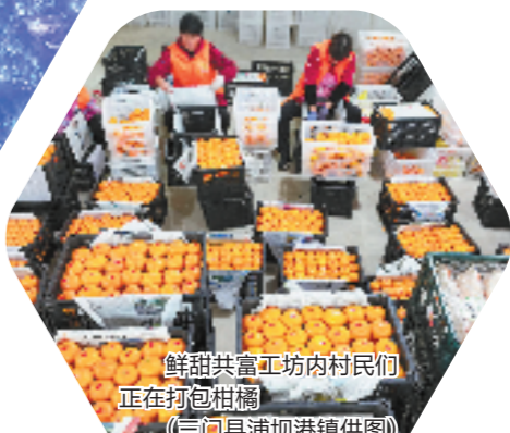
三门县浦项港镇村民们正在打包柑桔