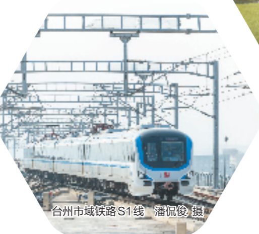
台州市域铁路S1线

搭建这座“城市矿山”的路桥人在欧美国家布局回收站点约260个,东南亚国家回收站点约160个,日韩回收站点约30个,掌握了日本、韩国、马来西亚、越南等国近80%的回收量,在国内广东、