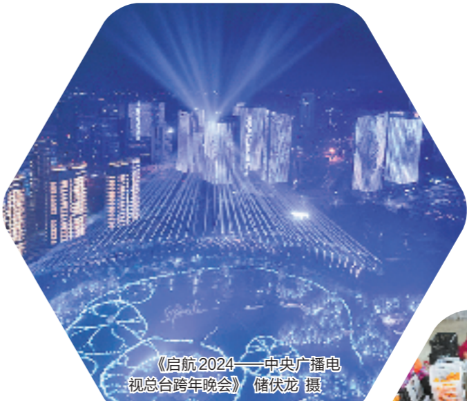
《启航2024——中央广播电视总台春节联欢晚会》

台州是制造业大市,这里拥有128万技术工人,占总人口近两成。2022年7月,台州成为全省首个全域技能型社会建设试点,实施技术工人“护中”改革,探索通过健全技能培育体系、技能运用体系,技