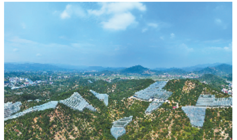
数字化管理精品杨梅示范园

从传统农业向设施化、规模化农业转型,再升级到现代化智慧农业,陶奉源的杨梅园“升级”之路,正是省农担公司兰溪办事处送金融活水到田间地头,帮助农企实现破茧成蝶的真实写照。接下来,该办事处将持续做好金融支农工作,充分发挥政策性农业信贷担保功能,进一步撬动金融资本投入农业农村,推动兰溪地方特色农业产业高质量发展。