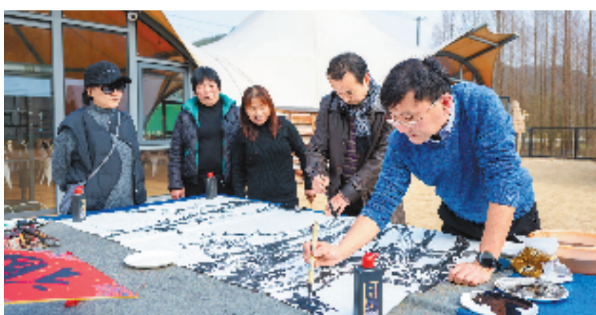
12月30日,由省委宣传部指导,省文化和旅游厅、浙江日报报业集团、省文联主办,宣传半月刊杂志社、浙江省画院联盟、杭州画院、杭州市美术家协会、临安区文联、天目山镇政府承办的“月亮”“桥”见未来——2023天目山大型画家、媒体采风活动暨发现和培育宋韵文化区域传承案例启动仪式在杭州市临安区天目山镇月亮桥村举行。图为活动现场。