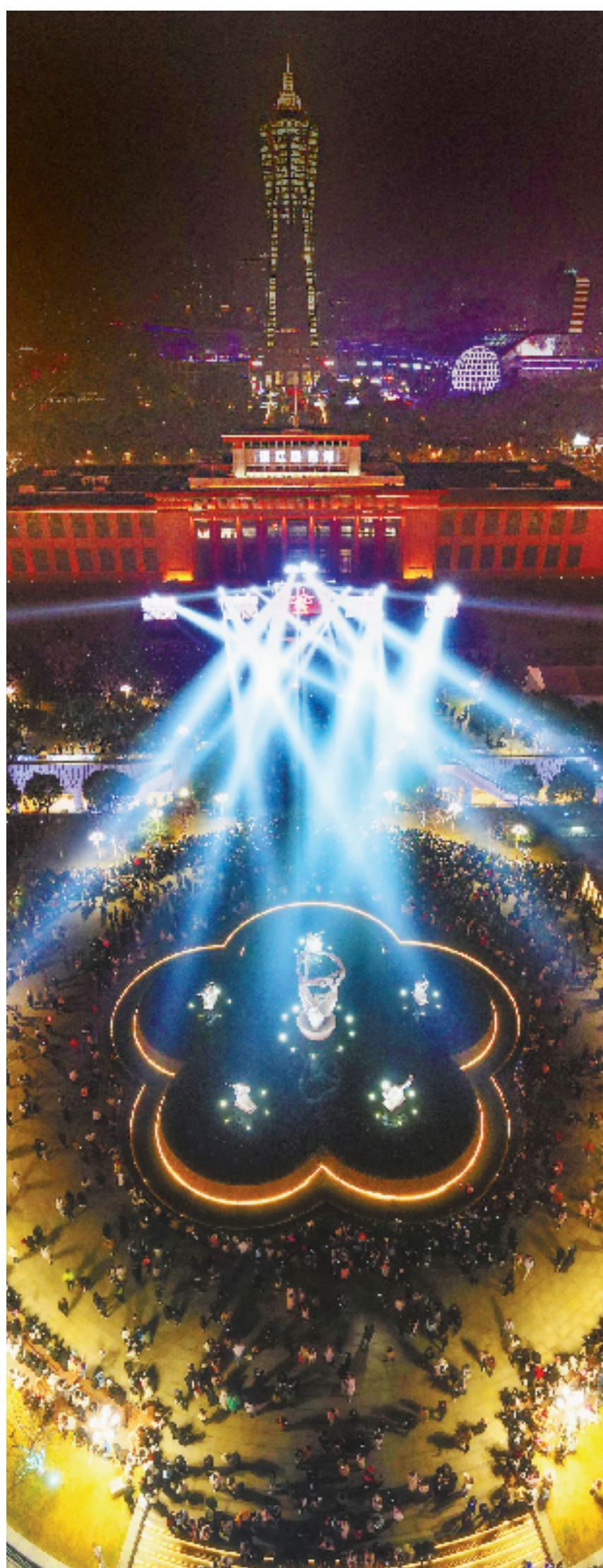
12月31日晚,杭州武林广场,众多市民在近3个小时的歌舞视听光影盛宴中,共同迎接2024年的到来。

本报莲都12月31日电(记者 郭敏 区委报道组 郑佳仑)古堰画乡百年古樟树下祈福,街巷转角处偶遇橱窗音乐、甌江上“飞天龙凤”冲出天际……31日晚,地处丽水市莲都区大港头镇的古堰