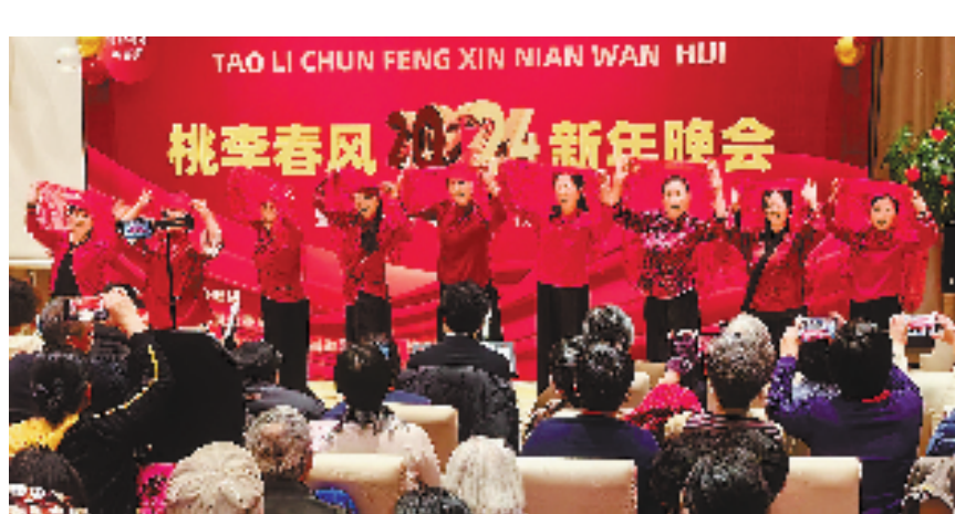
12月30日晚,杭州桃李春风小区居民载歌载舞,以歌唱祖国为主题的新年晚会精彩纷呈。