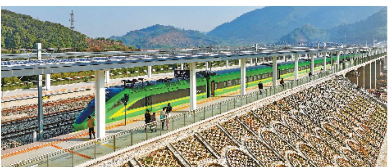
12月31日上午9时,C695“绿巨人”复兴号动车组到达奉化溪口站。

本报讯(记者 金梁 张帆)开放大省浙江,再添一条开放通道。2023年12月31日8时20分,C695“绿巨人”复兴号动车组驶出宁波站开向金华,历时7年建设的甬金铁路正式通车,世界第一大港宁波舟山港可以直通世界小商品之都义乌。