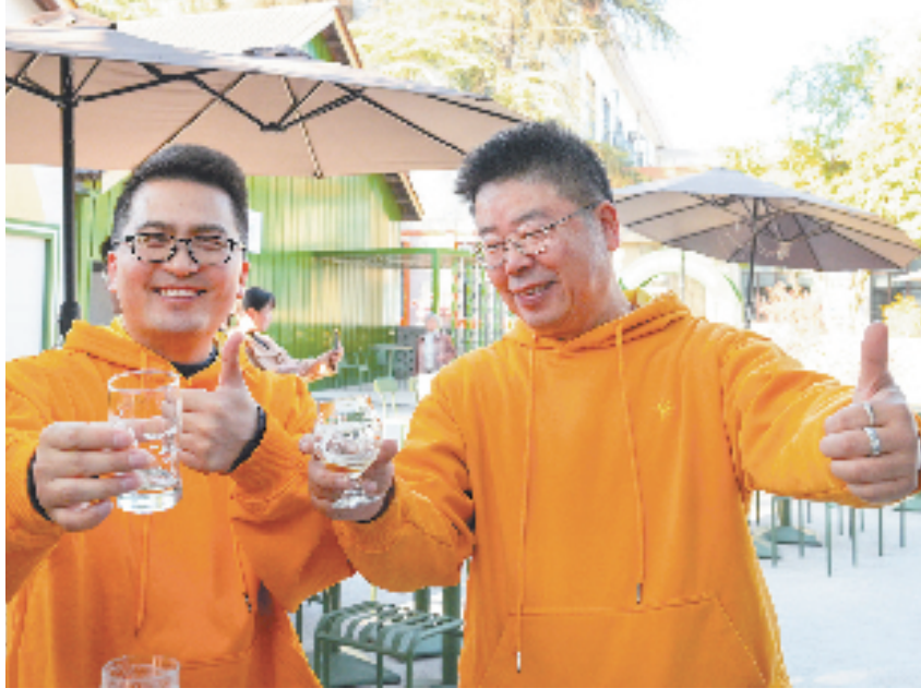
建德市新联会会员在青创·同心荟开展联谊活动