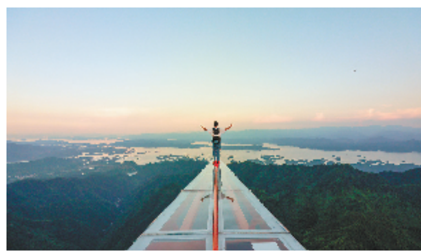
千岛湖沪马探险乐园

比如，在农旅融合上，依托丰富的稻、茶、蚕、果、中药材等农业资源，姜家镇已建成精品果园7个，种植优质水果2000余亩，春季赏花、秋季采摘已成为重要的农业旅游产品。