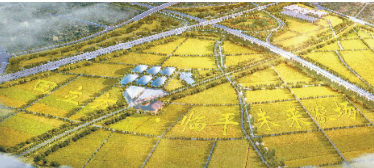
田立方·临平未来农场

集团建立党建联建，在组织共建、人员共融、资源共享、活动共办、难题共解等五大方面持续开展深度合作。