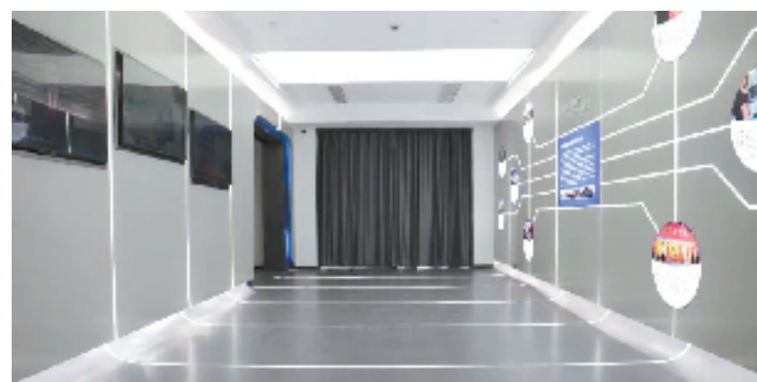
乔网智治一云上中心

全域土地综合整治与生态修复工程是临平区接沪融杭发展战略的有力引擎，正全力推动着临平南融的加速度。随着城市化进程飞速发展，身为“要塞”的乔司也将不断“蝶变”，在“后全域治理时期”抓住机遇，拥抱变革，在万亩土地上展开全新画卷。