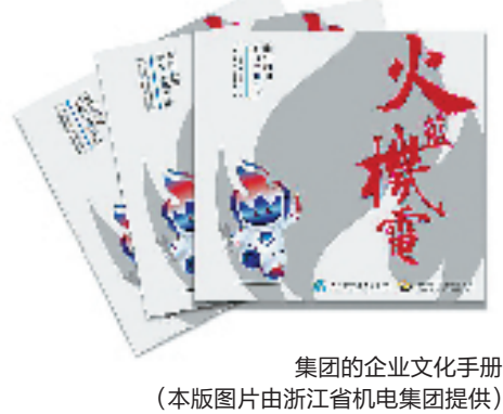
集团的企业文化手册