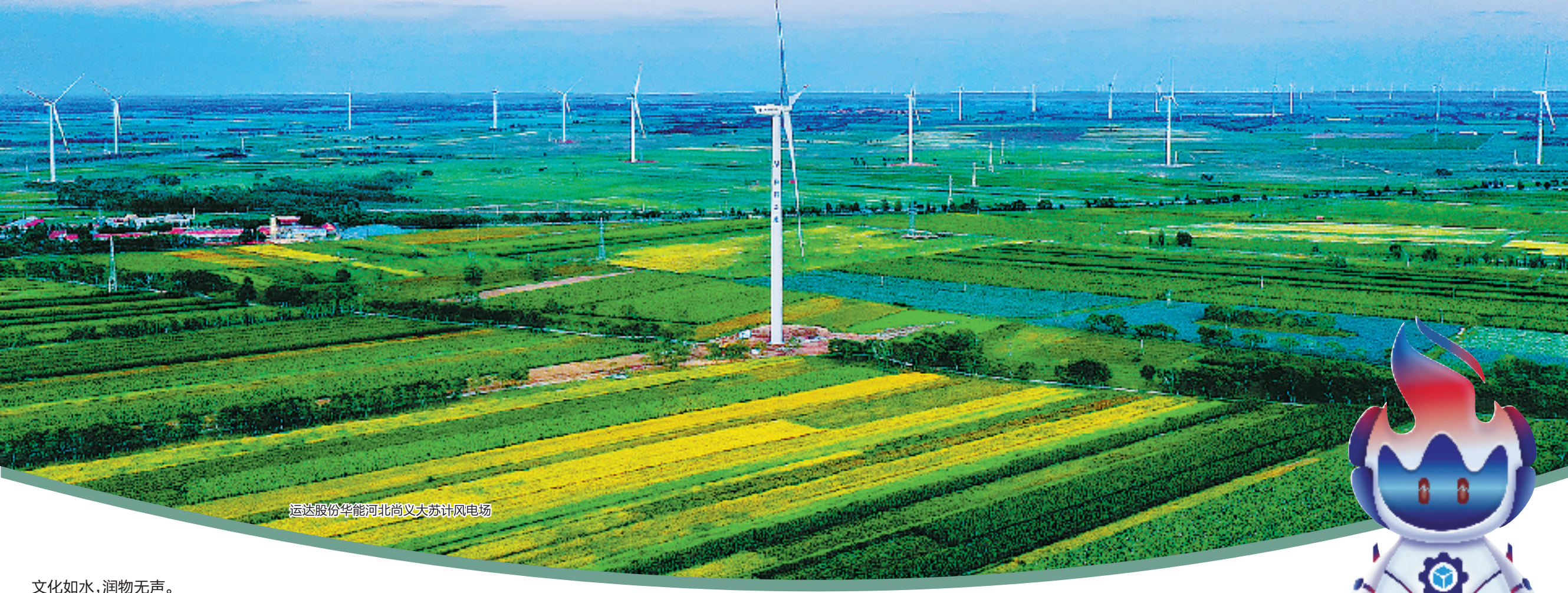
运达股份华能河北尚义大苏计风电场