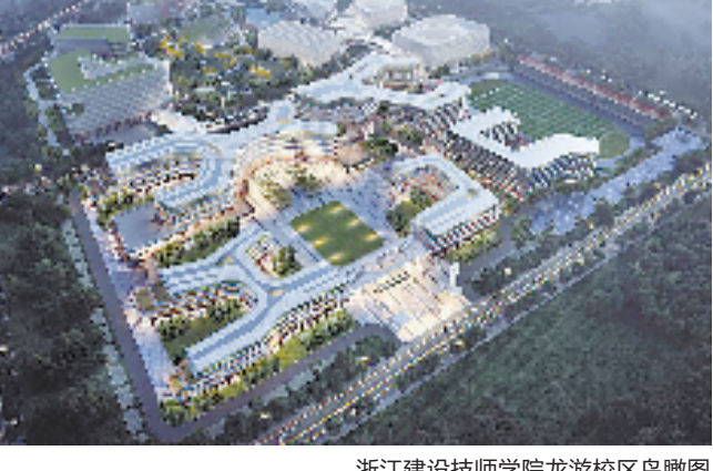
浙江建设技师学院龙游校区鸟瞰图

新时代新征程,浙江省机电集团坚持守正创新、价值导向、品牌引领,今年着力重塑集团文化,擦亮“火蓝机电”鲜明底色,推动“三维五心六型”文化体系落地见效,实施五心工程,打造五大高地,充分发挥集团文化的塑造作用、导向作用、激励作用和辐射作用,扎实推动高水平文化强企建设取得新进展。“精进、奋进、共进”的红色脉搏铿锵有力,开启浙江机电高质量发展新篇章。