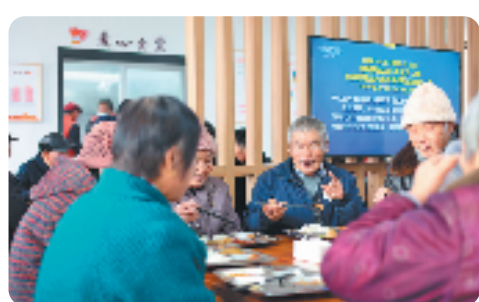
诸暨市赵家镇潘村爱心食堂