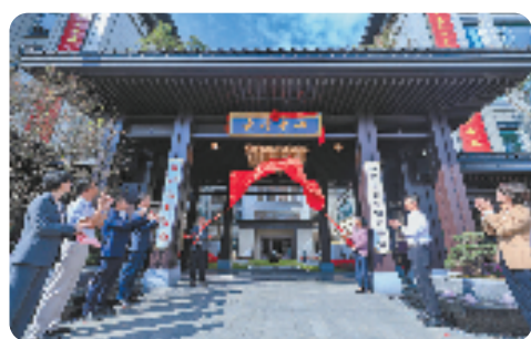
新昌县长者中心揭牌

此外，绍兴市还积极探索养老产业高质量发展新模式。柯桥区国企参与养老事业和产业发展试点被列入省级共同富裕试点名单，揭牌成立浙江金柯桥康养产业发展集团有限公司，为全省国企参与养老事业和产业发展提供可复制可推广的柯桥经验。