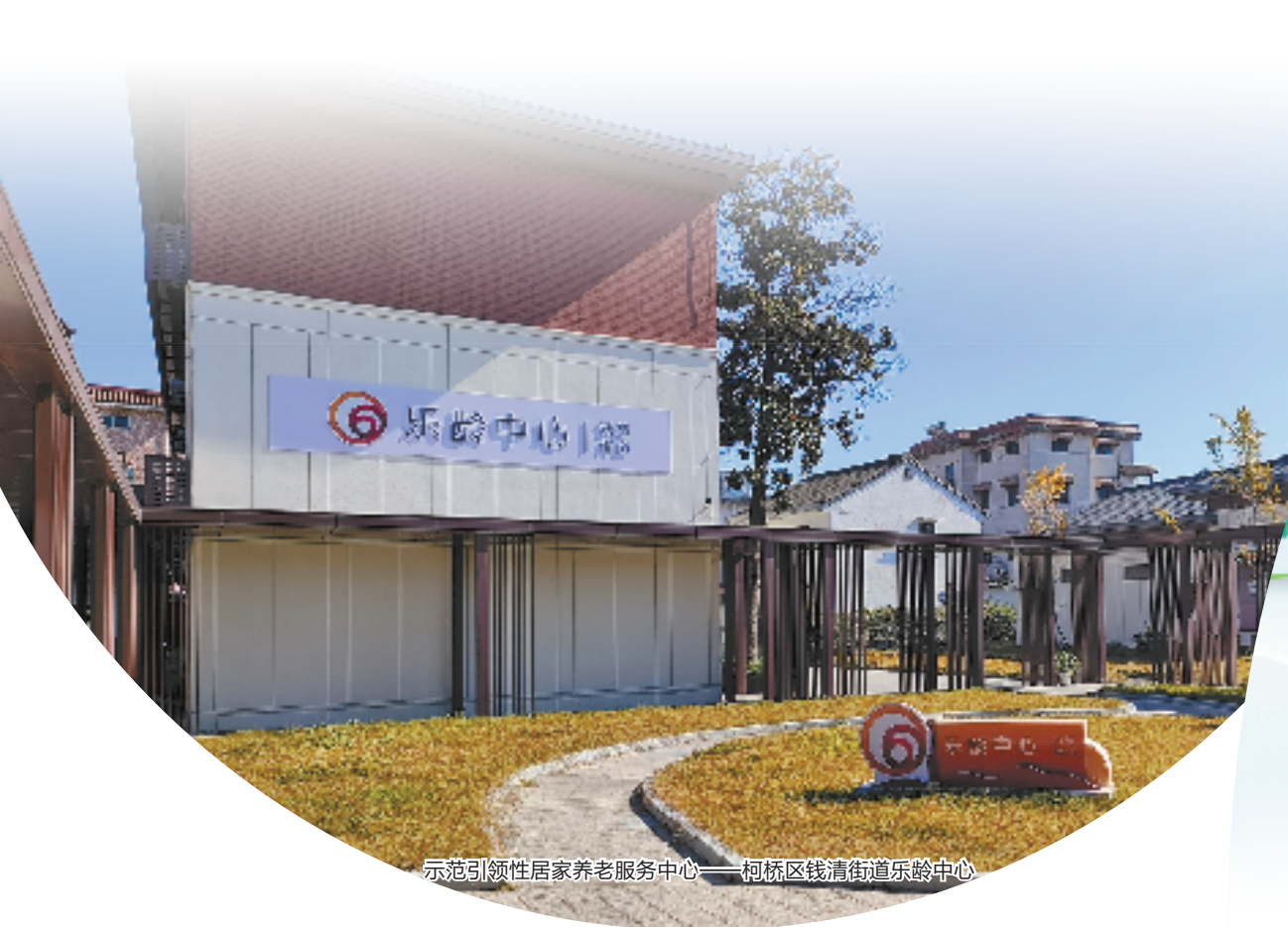
示范引领性居家养老服务中心——柯桥区钱清街道乐龄中心

今年以来，绍兴市民政局秉持“胆剑精神”，立足职能使命，广泛联合社会力量，积极构建服务体系，着力解决人民群众急难愁盼问题，探索形成了一批可复制可借鉴的样板经验，在绍兴“五创图强、四进争先”的新征程上留下浓墨重彩的一笔。