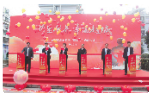
越城区养老服务“爱心卡”启动仪式