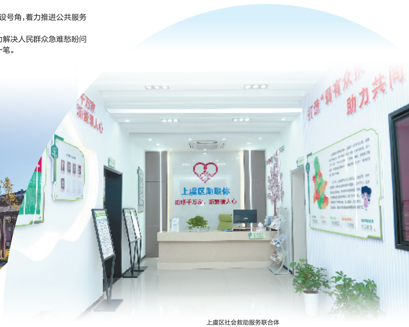
上虞区社会救助服务联合体