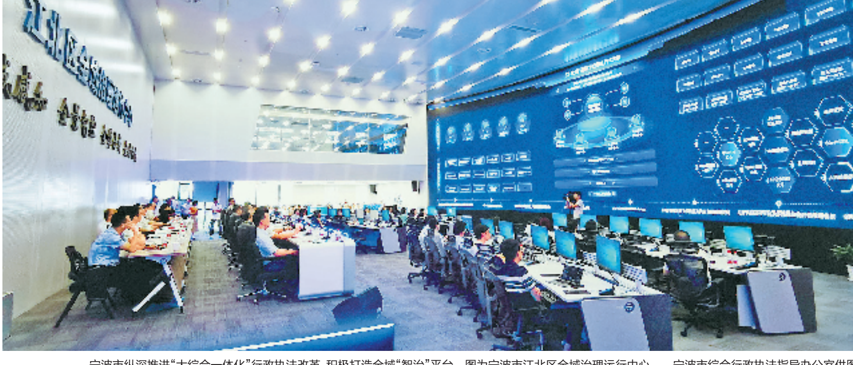
宁波市纵深推进“大综合一体化”行政执法改革,积极打造全域“智治”平台。图为宁波市江北区全域治理运行中心。

2003年,浙江省委作出“八八战略”重大决策,将“法治建设”确立为优化浙江发展软环境的重中之重。2006年,浙江省委十一届十次全体(扩大)会议作出建设“法治浙江”的决定,法治建设被提升到前所未有的战略高度。“法治浙江”实践的展开建立在大量调查研究的基础上,集中体现为区域先行法治化,即在遵循国家法治发展总体方向的前提下,适应特定空间范围内的区域发展现实需求,建构有机协调的区域法治秩序,推动区域发展的法治进程。17年来,“法治浙江”的内涵不断深化和完善,为建设更高水平的法治中国提供了浙江样本。