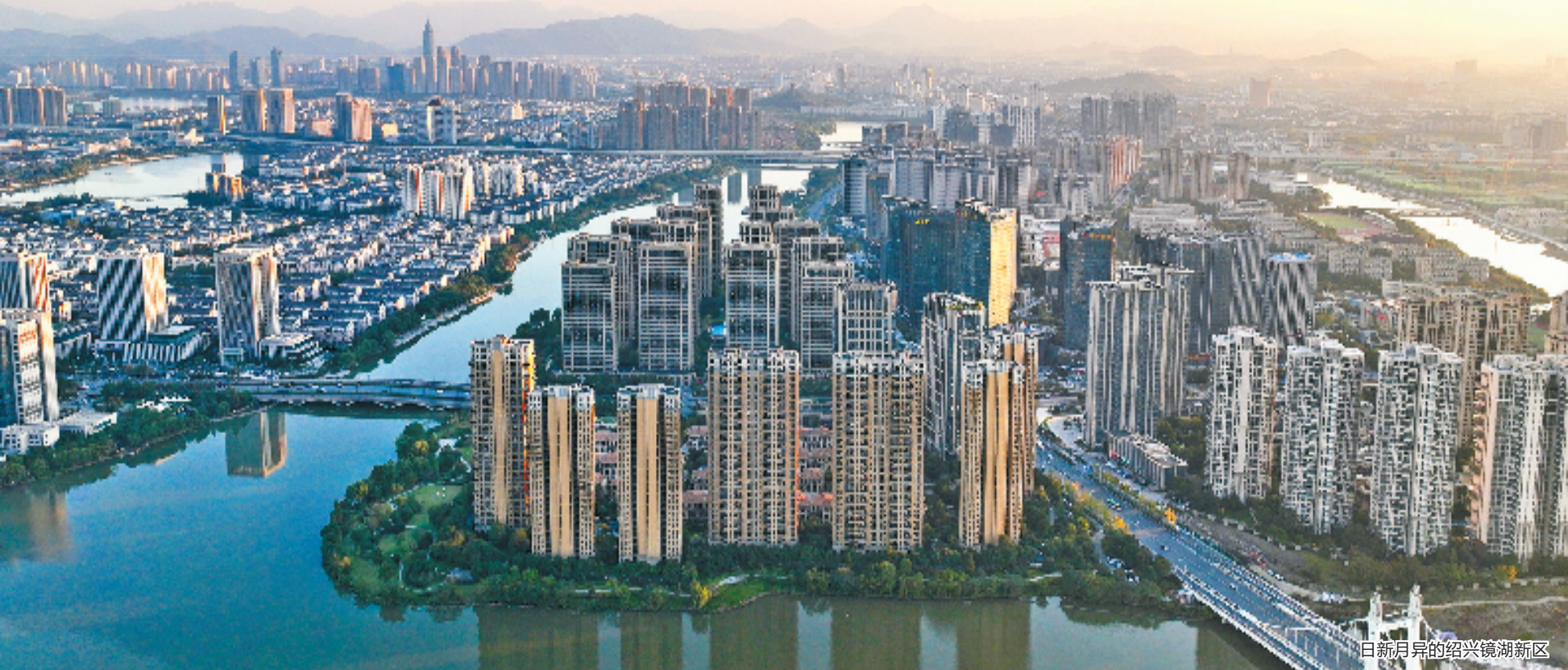
日新月异的绍兴镜湖新区