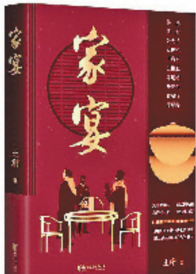
《家宴》书封。浙江文艺出版社供图