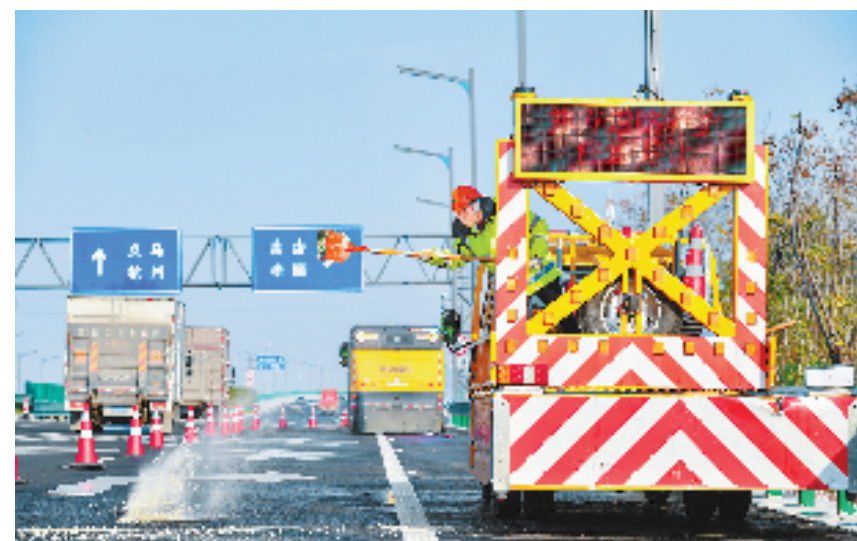
12月21日,在金义中央大道上,金华交投迅达公司的道路养护人员对路面、桥梁等重点实时测温,同时对容易结冰的桥梁、路段进行抛洒融雪剂处理,保障全线畅通。