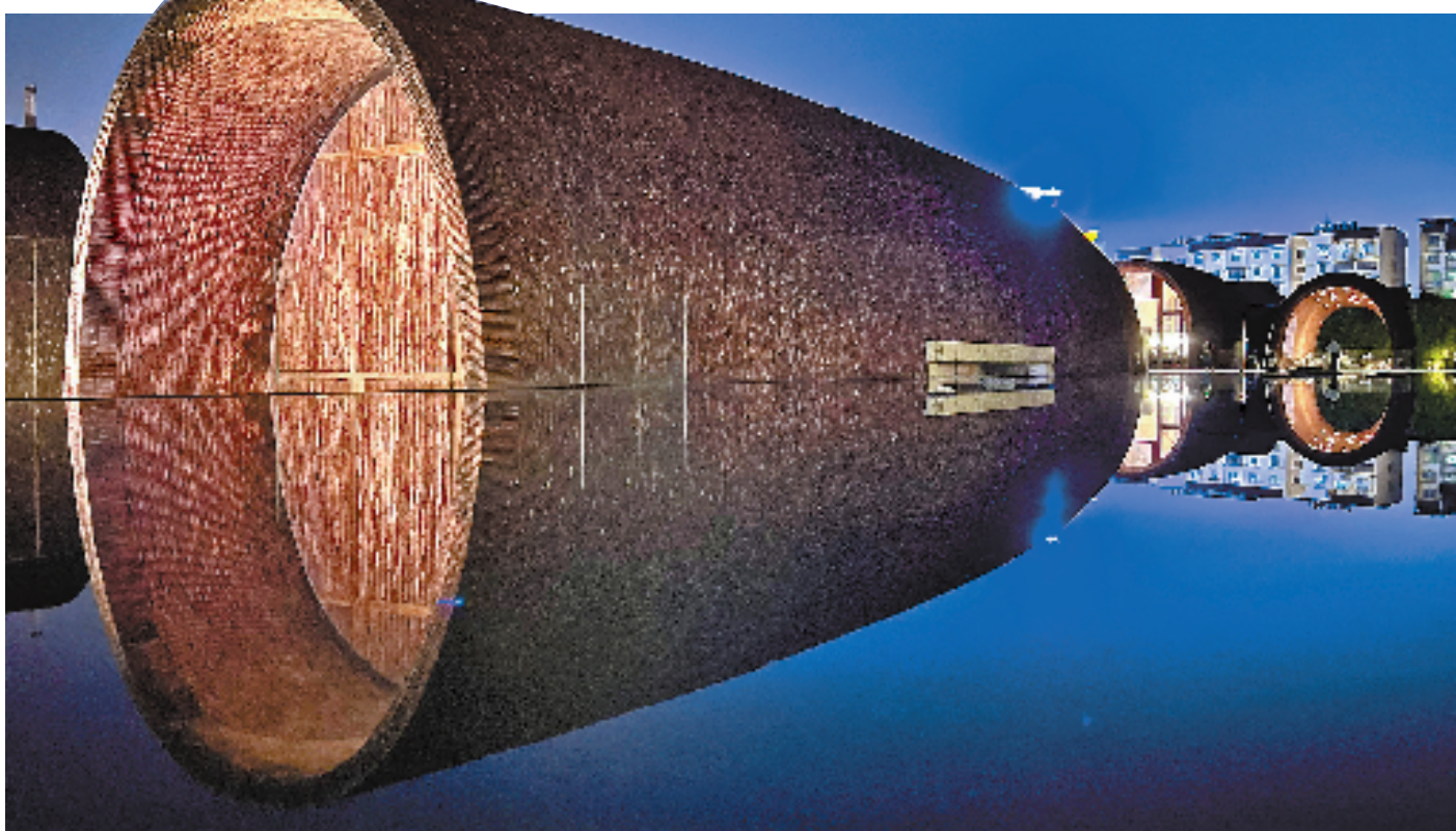
景德镇御窑博物馆夜景。