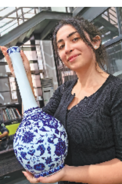
迪兰展示最新完成的荷花主题作品。