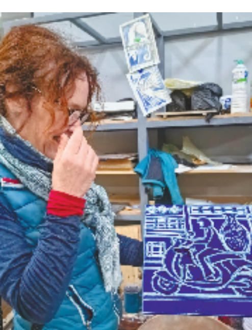
埃莉诺的作品中融入了很多景德镇元素。