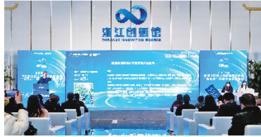
“浙江拍”科创平台专场活动现场

“安心屋”的上线,让职务科技成果转化从传统国有资产管理制度的束缚中解放出来,让科研人员知识价值在“阳光”下熠熠生辉。目前,“安心屋”累计入驻单位180余家,近5万项存量职务科技成果和技术类无形资产实行单列管理,超300项科技成果以全链条管理方式进行盘活转化,科研人员转化成果、盘活资产的积极性主动性有效提升。2023年1-11月,全省技术交易总额达4838.05亿元,同比增长95.18%。