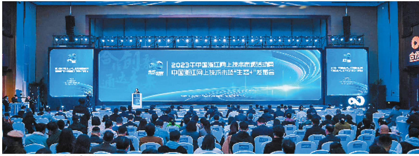
中国浙江网上技术市场“生态+”发布会现场

在这里,创新与合作“蓄势赋能”,技术与市场“双向奔赴”,产学研协同“一拍即合”。全力构建具有全球竞争力的开放创新生态,必将为浙江在奋力推进中国式现代化新征程上勇当先行者、谱写新篇章提供更强科技支撑,为加快建设科技强国、实现高水平科技自立自强贡献更多浙江力量。