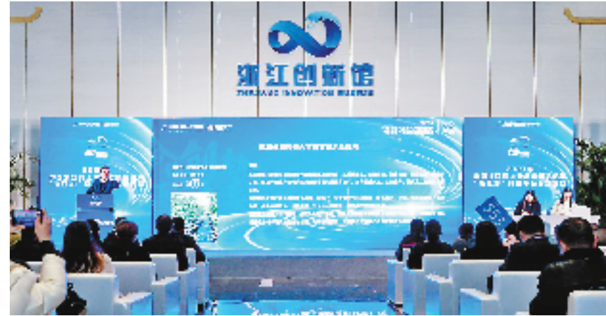
“浙江拍”科创平台专场活动现场

“安心屋”的上线,让职务科技成果转化从传统国有资产管理制度的束缚中解放出来,让科研人员的知识价值在“阳光”下熠熠生辉。目前,“安心屋”累计入驻单位180余家,近5万项存量职务科技成果和技术类无形资产实行单列管理,超300项科技成果以全链条管理方式进行盘活转化,科研人员转化成果、盘活资产的积极性主动性有效提升。2023年1-11月,全省技术交易总额达4838.05亿元,同比增长95.18%。