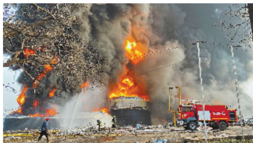
12月18日,消防员在几内亚首都科纳克里的燃油仓库火灾现场救火。

几内亚过渡政府当天发表声明说,科纳克里除国防安全部门和医疗行业外,其余公共和私营部门工作人员都将保持居家状态,所有学校、加油站都将关闭。政府将对事件原因和责任人展开调查。