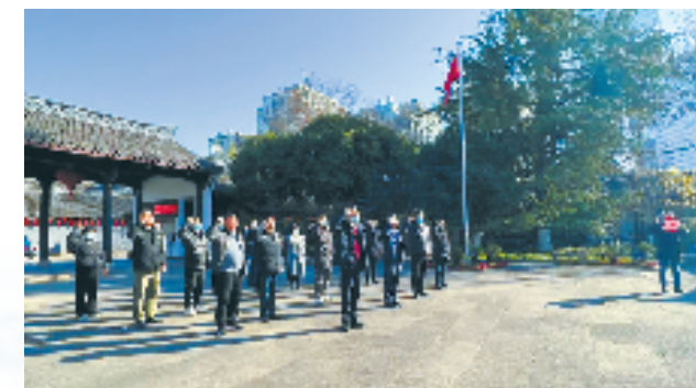
市社党委组织开展“弘扬革命精神，开拓供销事业”活动

命转化。绍兴供销社还把促进流通保供作为社有经济发展的“生命线”来抓，聚焦“菜篮子”“米袋子”和“果盘子”，以市区11家农贸市场和1家粮食批发市场为载体，做好保供稳价工作，描绘兴农惠民好“丰”景，不断把供销社的组织网络优势转化为农产品的流通渠道优势，兴农助农、惠民为民，探索再造供销融合发展新样本。