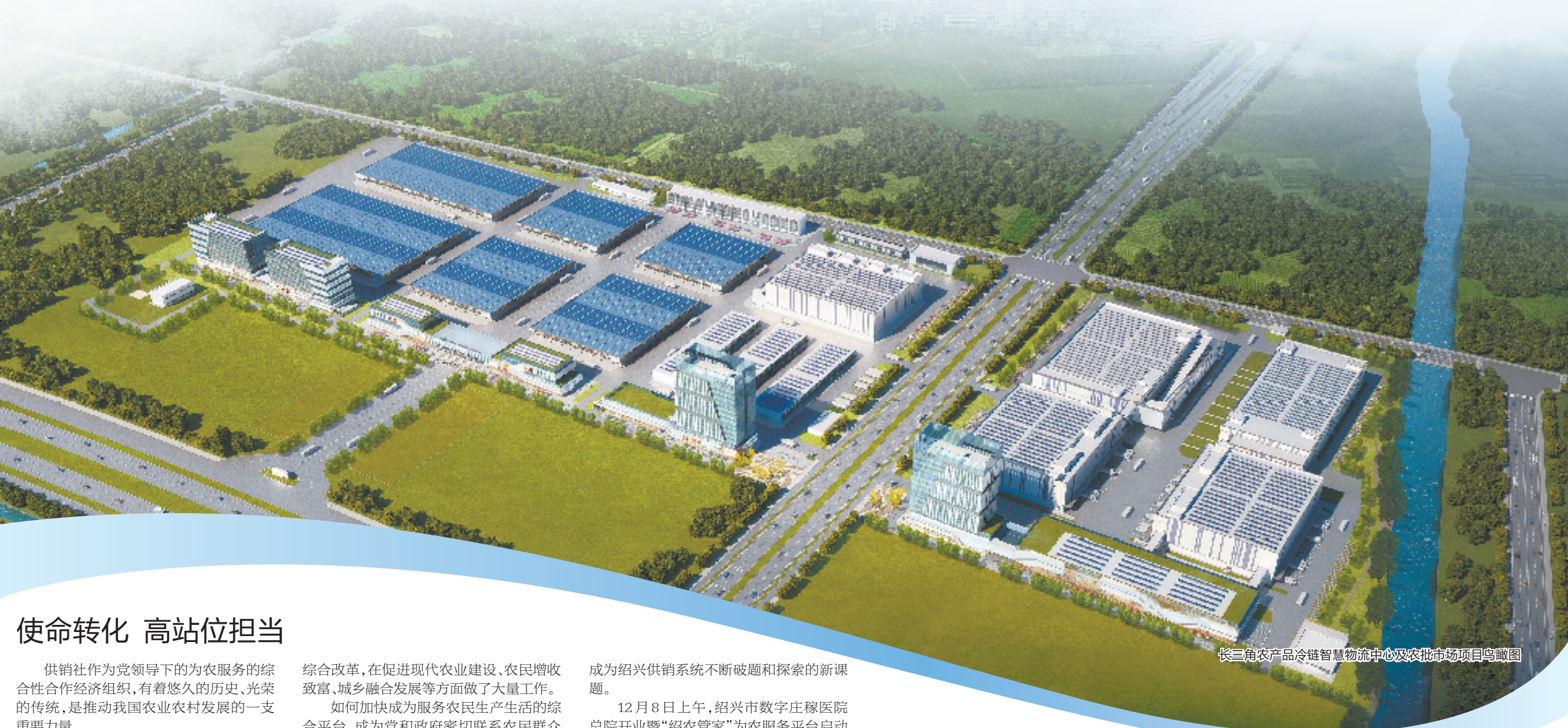
长三角农产品冷链智慧物流中心及农批市场项目鸟瞰图

牢牢拧住“归心、赶考”两件大事，“归心”即牢记嘱托、感恩奋进，变“指标牵引”为“使命牵引”；“赶考”即从问题入手，蹚新路、开新局，由此翻开了关键“三转”的崭新篇章。