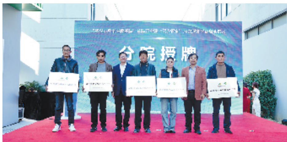
“绍兴市数字庄稼医院”总院开业暨“绍农管家”为农服务平台启动仪式基层网点授牌