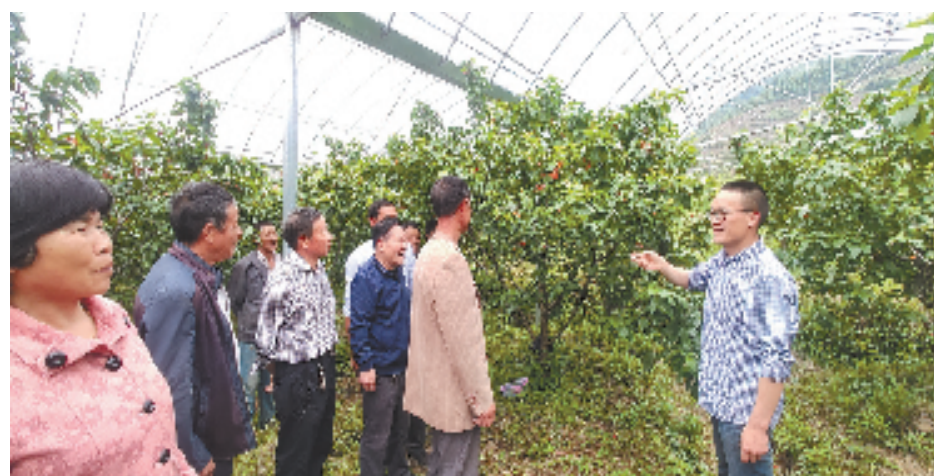
绍兴市樱桃产业农合联组织开展农技培训

同时，依托“红色供销论坛”等载体，教育和激励干部职工坚守人民情怀和为农服务宗旨。大力弘扬“扁担精神”“背篓精神”，进一步传承革命精神，发扬优良传统，奋力投身新发展阶段供销合作社改革发展的生动实践。