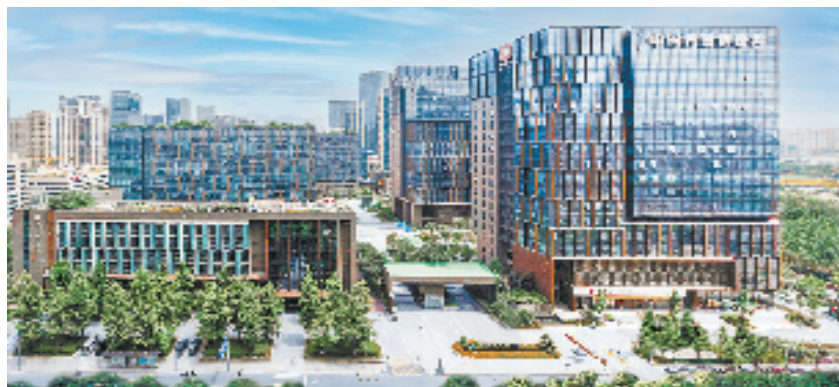
“信息港湾·数字创新谷”特色产业风貌区

SINO SURE 中国出口信用保险公司 浙江分公司 CHINA EXPORT & CREDIT INSURANCE CORPORATION Zhejiang Branch