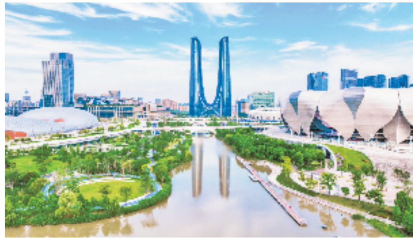
杭州“心相融·达未来”亚运风貌样板区

共富风貌驿站，作为萧山区深化推进城乡风貌整治提升工作的重要载体，在满足本地百姓需求、为大众生活提供便利的基础上，梳理出了相对低效或闲置的小微空间，将其盘活打造成设施完善、功能齐全、活动丰富的场所，切实将萧山风貌提升的成果转化落地为群众可知、可感、可体验的惠民成果。比如，三泉王村的茶果驿站，就是一个功能多样的综合体，既是线下的共富超市，有土特产品展陈和售卖，还搭建起助农直播间，让农户带上手