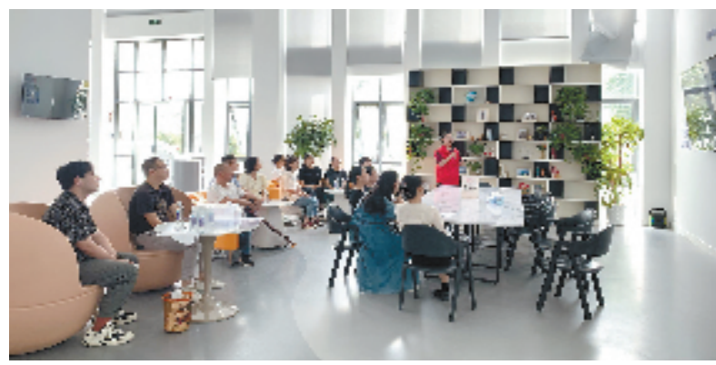
“侨胞之家”组织开展培训

值得一提的是,百步镇也积极开展暖心为“侨”服务,明确重要、传统节日必访,侨界人士生活困难必访等“五必访”工作制度,入户走访掌握了解侨眷实际困难,立足需求积极帮助解决,并在重要时间节点,适时开展送温暖活动,让侨胞侨眷感受关怀。