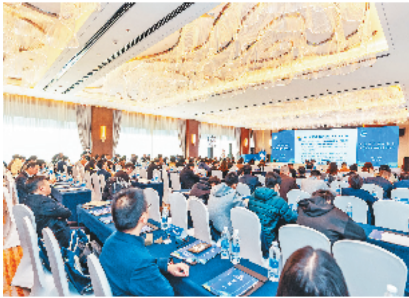
第五届浙江省高质量发展智库论坛

论坛还发布了《2023浙江省地瓜经济县域高质量发展报告》和《2023浙江省地瓜经济基层单元高质量发展报告》,展示浙江在打造高能级开放强省探索中的地方样本。