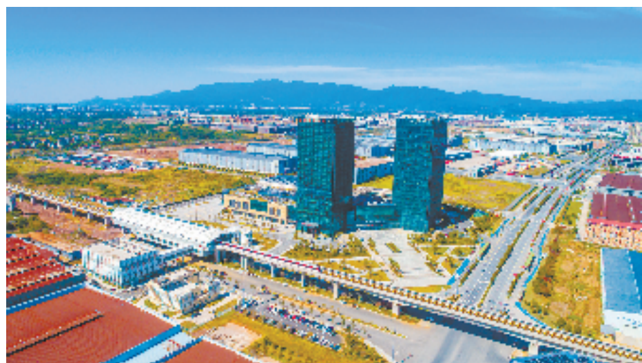
金义综保大厦航拍图