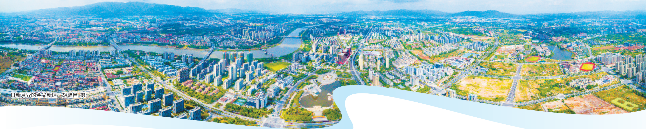
日新月异的金义新区

今年以来，金义新区把整个新区作为全省重点发展平台来打造，牢固树立“项目为王、速度为金”理念，制定“十个一”重大突破性项目任务清单。通过大干项目、干大项目，金义新区加压奋进、全速冲刺，推动工业企业转型升级，产业集群成群。平台、项目、产业“三大突破”，正引领金义新区发展大突围、能级大跃升、实力大跨越。