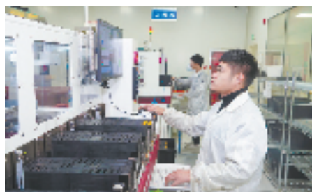
浙江省龙芯中科测试车间内，自动设备 24 小时高效运转，芯片测试量一年超百万。

除了自贸试验区和金义湖两大主平台，金义新区还着力打造江岭高新智造区、东孝贤创区、东湄中央未来区、胡思零碳产业园、金磐“产业飞地”等五大特色平台，搭好平台筑巢引凤，不断夯实产业根基。