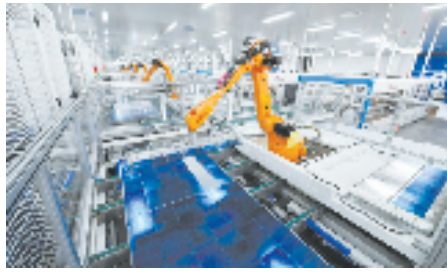
浙江润马光能集团有限公司一期智能化车间，机械臂伸展自如。