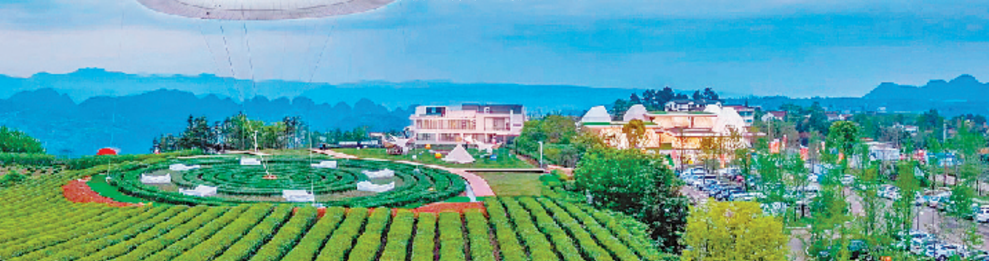
新昌下岩贝村腾云天使环

初冬清晨晨霜刚退,新昌县东茗乡下岩贝村游客中心游人如织,“我们专程从上海自驾过来,感受下原生态的自然美景。”一位游客难掩喜悦地说道。游客口中的美景,离不开土地综合整治的统筹规划,从“粗放式”发展的普通小山村进阶成为“规范化”网红打卡地,得益于新昌县探索出的“治理+文旅”山区土地综合整治治理体系。