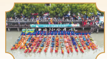
2023桐乡·崇福端午民俗风情活动