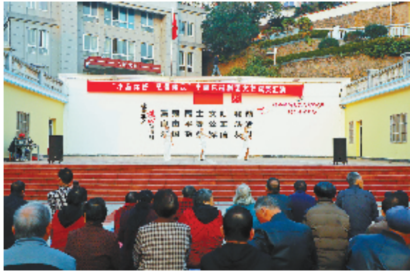
嵊山镇乡贤邀请舟山小白花越剧团为老百姓送上文艺演出

下一步,嵊山镇将继续立足海岛实际,用好用活统战元素,引领党外人士、民营经济人士、党外知识分子、新乡贤代表和新的社会阶层人士等统战力量,以提高渔农村群众生活品质、解决实际需求为出发点和落脚点,积极探索统战服务新模式新功能,不断提升群众获得感、幸福感和安全感,形成统一战线广泛参与“一老一少”工作的蓬勃局面,为高质量发展“百年渔场 魅力嵊山”贡献力量。