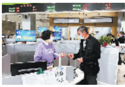
工作人员为市民提供社保政策咨询服务

今年,海盐县人社局在全省首创“难事帮办”窗口,针对人社领域“疑难杂症”开辟“绿色通道”。目前窗口已接待群众1000余人次,妥善处理