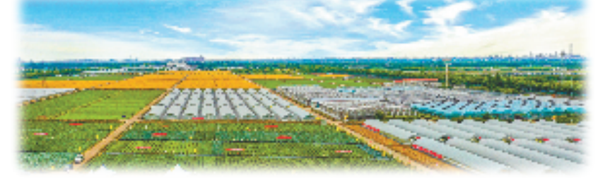
浙江省种业集团萧山育种实验基地

秉持“三农”情怀,省农发集团从山海湖泊测绘、全域土地整治到现代产业导入,全面激活乡村产业振兴“强劲引擎”。