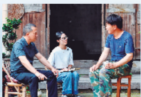
干部带着民情日记本走访群众