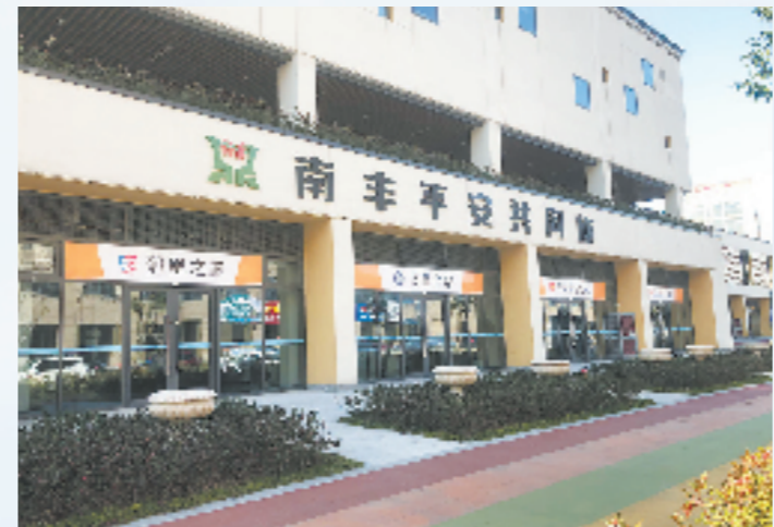
平安共同体建设推动共建共治共享

柯桥区安昌街道打破了地域限制,和毗邻的萧山区瓜渚镇实现区域联动发展,通过网格互动在矛盾纠纷化解、经济社会发展、生态环境治理等方面展开深度合作。如两地合作实施安昌路北延工程,打通连接两地的“断头路”,有效促进了人口、产业的交流互动。 有了“枫桥经验”的保驾护航,“千万工程”的推进也是顺风顺水。目前,绍兴已累计创建省级新时代美丽乡村示范县4个、美丽乡村示范带25条、美丽乡村示范乡镇62个、美丽乡村特色精品村184个,创建省级农业精品村,助力农民增收。“罗国海说,大家共享发展红利,关系自然和谐了起来。矛盾少了,人心齐了,塘塘的发展日新月异。 网格的优势不仅是“分而治之”,也可以