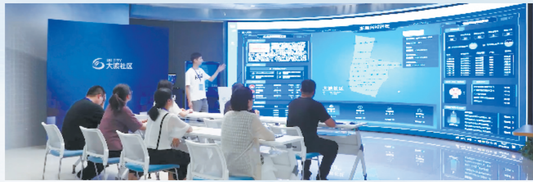
社区干部学习“浙里兴村治社”应用