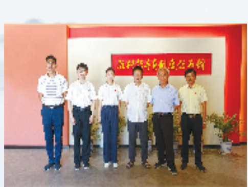
驻村指导员一任接着 一任助力平安建设