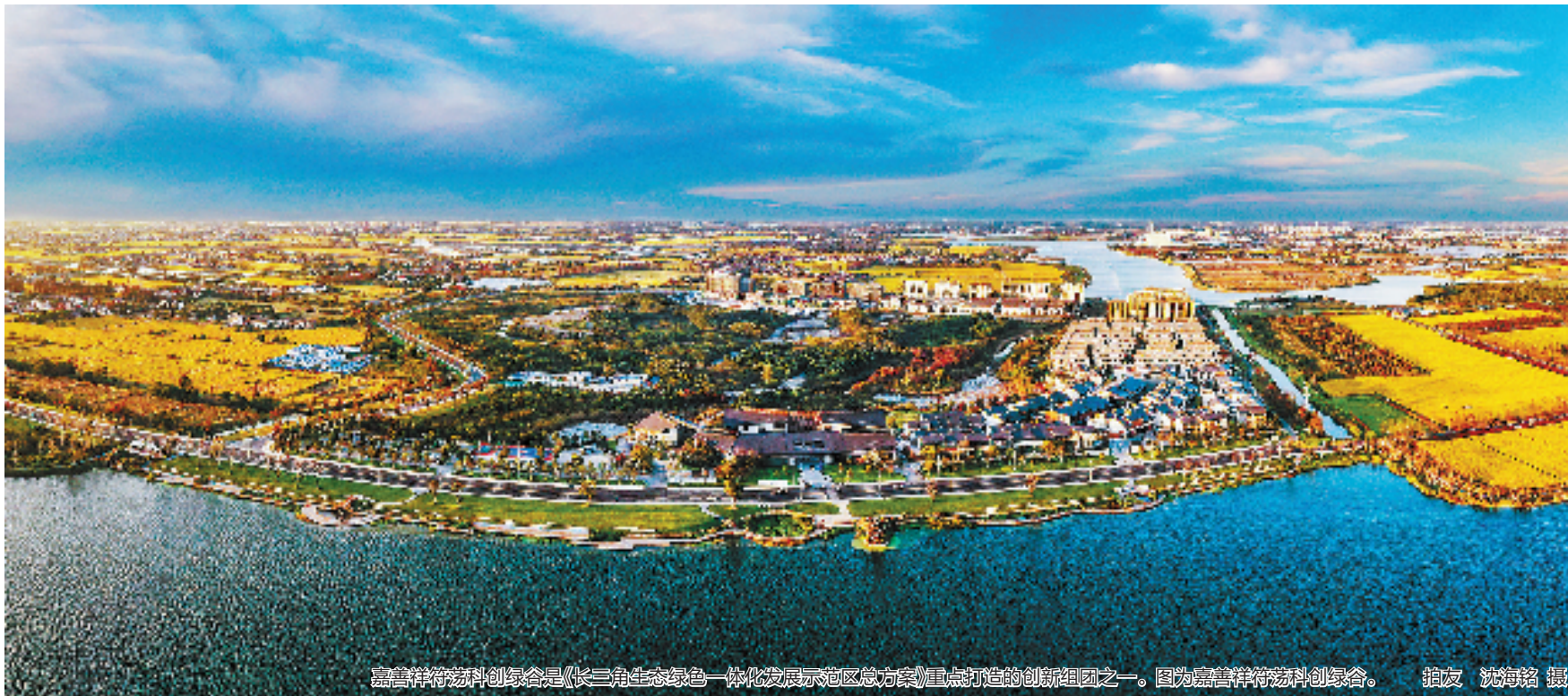
嘉善祥符科创绿谷是《长三角生态绿色一体化发展示范区总方案》重点打造创新组团之一。图为嘉善祥符科创绿谷。

2018年,习近平总书记宣布支持长江三角洲区域一体化发展并上升为国家战略。客观上说,在国际环境不确定性因素增多的背景下,长三角一体化发展战略实施五年来,长三角区域经济发展为全国稳增长发挥了“压舱石”作用。从2018年至2022年间,三省一市地区生产总值年均增速约为5.5%,高于同期全国平均增速5.2%,占全国GDP的比重基本保持在24%,呈稳定发展态势;GDP过万亿的城市从6个增加到8个,占全国“万亿城市”总数的三分之一。长三角一体