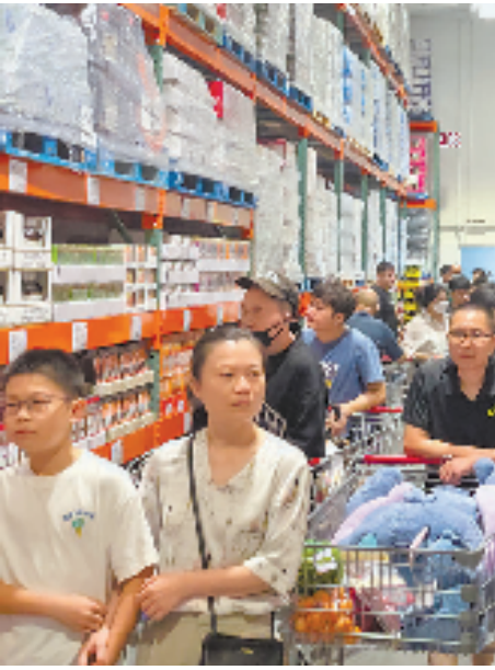
来自美国的仓储超市开市客在杭州萧山开设门店,营业首日生意火爆。

实际上,除了制造业,杭州实际利用外资的结构体现了大幅度优化,科学研究和技术服务、金融业等领域占比还在快速上升。优质的外资项目串珠成链,成为了杭州现代经济体系的再生力量。如在金融领域中,1-9月实际利用外资5.94亿美元,同比增长251%;在引资方式中,有7.27亿美元来自于“利润再投资”,即境外投资者将企业的利润用于在杭经营规模的扩大,展现这些企业对杭州产业结构升级、城市能级提升的坚定信心。