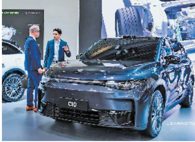
斯泰兰蒂斯以15亿欧元入股杭州企业零跑科技。