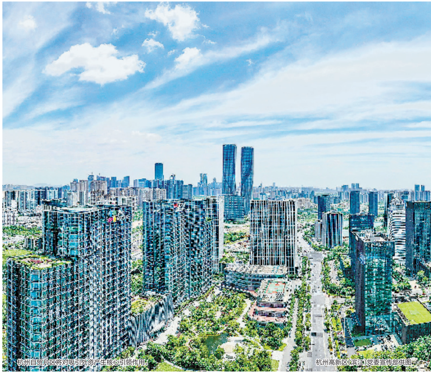
杭州自贸片区将对吸引外资产生核心引领作用。