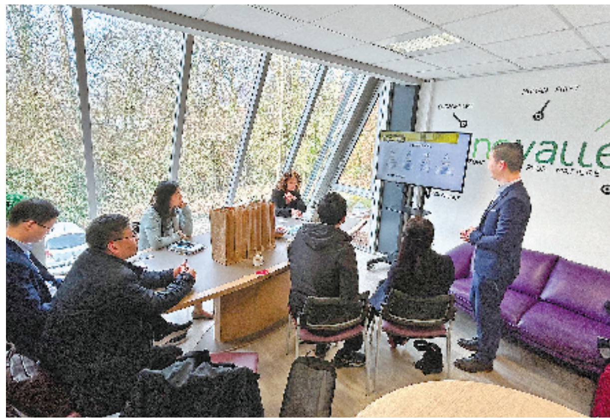
杭州市派出招商团前往国外企业洽谈引资。