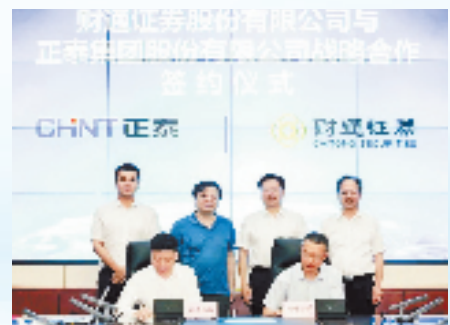
7月13日，财通证券与链主型企业正泰集团签订战略合作协议。

在中央金融工作会议“建设金融强国”“培育一流投资银行”的战略部署下，财通证券锚定“打造一流现代投资银行”目标，坚持“做浙商浙企自己家的券商”定位，建设科创型、服务型、平台型、变革型“四型财通”，不断深化服务内涵，扩大服务外延，争做壮大“地瓜经济”的有力实践者和积极推动者，为“地瓜经济”提能升级“一号开放工程”贡献财通力量。