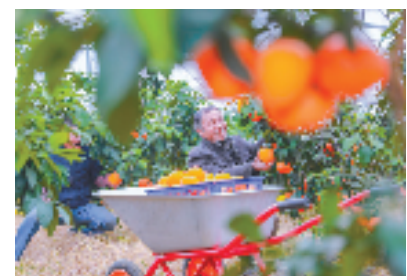
老年群众在练市镇“甜蜜惠农·共富工坊”内采摘柑橘

莫道桑榆晚，为霞尚满天。练市镇相关负责人介绍，接下来，该镇将继续围绕老年群体的日常需求，在助老送餐、老年文化中心建设、免费微公交、老年大学等场景提供更具优质的服务，也为老年人提供更多参与基层治理的机会，让老年群体真正实现老有所得、老有所为。