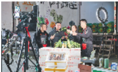
“嘉农小厨房”直播中

为民生福祉“加码”。之前，各成员单位通过认领，在拆迁安置小区——新月公寓里的楼道内安装了爱心折叠座椅，解决了老年人、残疾人等困难群体上楼难的问题。前不久，在“和合·嘉园”成员单位的大力支持，嘉兴商交园旁新月公寓小区内新建的羽毛球场顺利完工，小区居民休闲健身又新增了好去处。