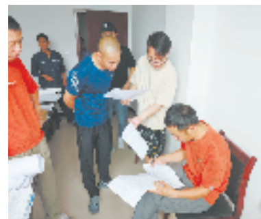
廉情护航员检查低保户用电优惠政策落实情况

爽、民风清朗”的发展环境，为乡村振兴注入新动力，不断提升人民群众的获得感、幸福感、安全感。