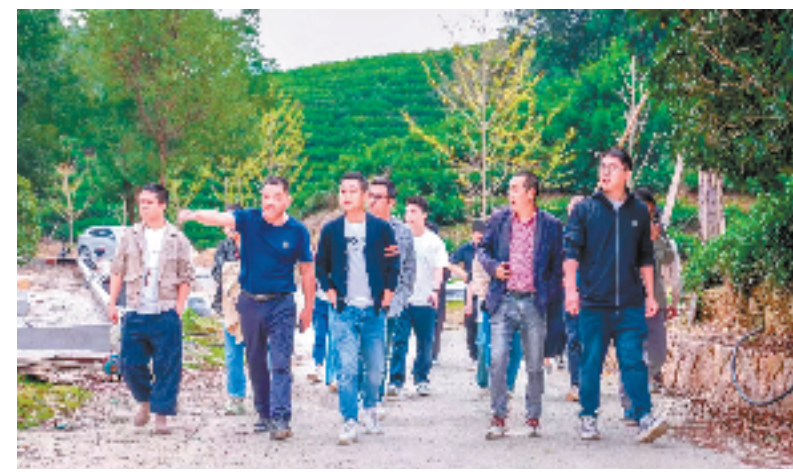
青年乡贤考察当地文旅项目

“我们将在18个行政村持续铺开‘知新同行凝聚力 统战青年筑未来’活动，以家乡的发展变化、项目的带动优势、党委的关心重视，不断提升乡贤回乡就业创业的信心。”杭垓镇统战战线负责人表示，接下来，该镇将进一步发挥返乡乡贤的示范引领、辐射带动作用，为乡村振兴聚力赋能、添砖加瓦。