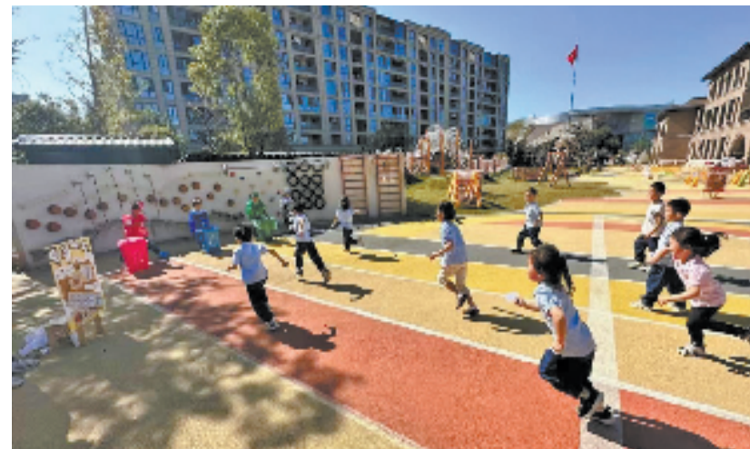
垃圾分类，玩转运动场

“以党建为引领，‘活力五常、创新分类’的启动，将进一步完善各社区垃圾分类工作机制，为五常街道垃圾分类工作添砖加瓦。”五常街道相关负责人说。下一步，余杭区五常街道将聚焦垃圾分类这一重要议题，实现信息互通、问题共商、互促互融的社区治理新场景，切实提升居民的幸福感和满意度，构建更加和谐、美丽的社区环境，展现更加文明、环保的形象。