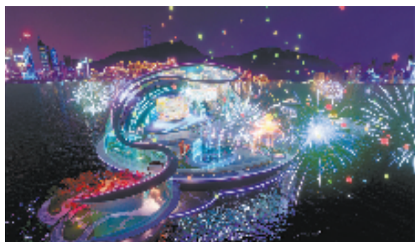
网易游戏元宇宙场景