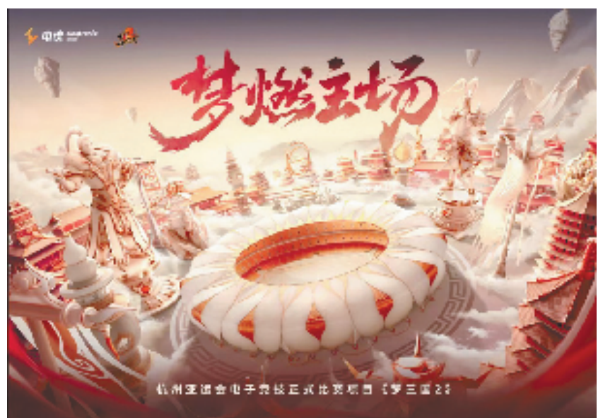
电魂《梦三国2》入选杭州亚运会电子竞技项目正式比赛项目

在完善数字化应用方面，滨江区持续完善“未成年人网络游戏防沉迷”应用建设，推广使用“浙里办”的涉未成年人网络游戏沉迷投诉通道，降低12345等渠道的信访量，同时实现游戏充值退费、账号封禁等行业问题处置与监管，有效降低信访投诉率。