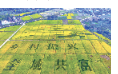
武义县大田乡千亩方永久基本农田整治

项省级试点，并在宁波市首创医保基金“社会监督员”制度，形成面向“参保群众+定点机构”的闭环监管格局，其中医保监管执法案例作为宁波市唯一案例被国家医保局评为优秀典型。