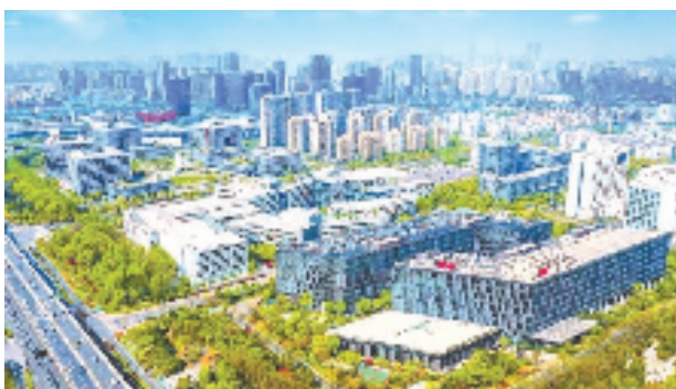
杭州高新区(滨江)打造电竞文化新地标